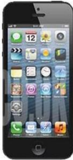
New iPhone 5*