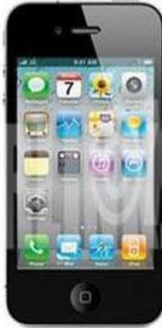
New iPhone 5*