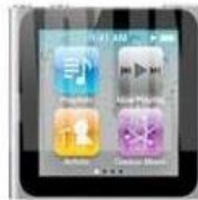
New Nano 7G*