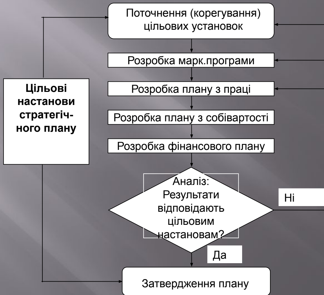
Схема процесу поточного