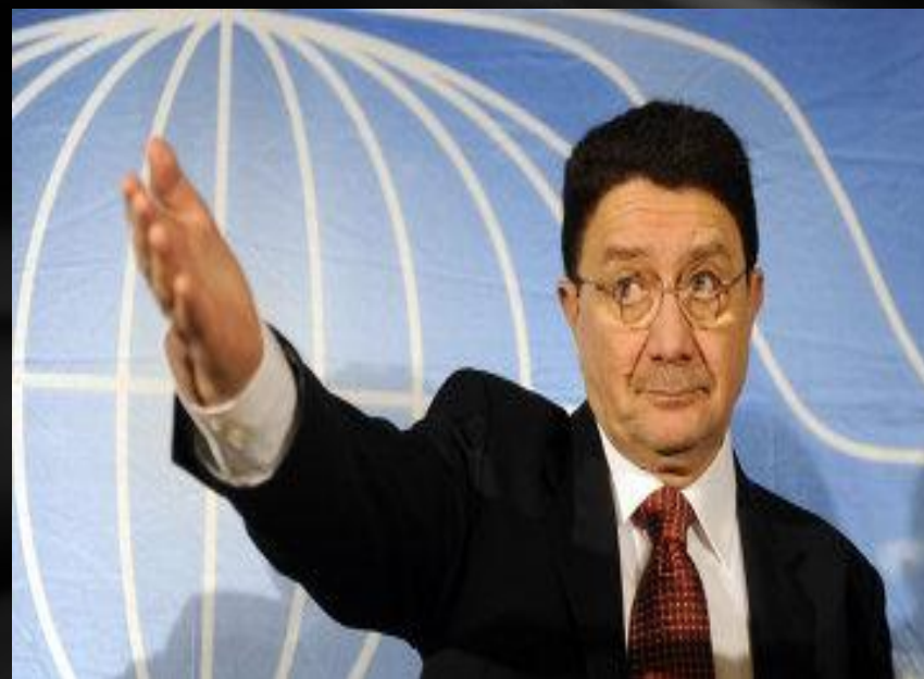
Генеральный секретарь Всемирной Туристской Организации

Официальные языки ВТО — английский, испанский, русский, французский.