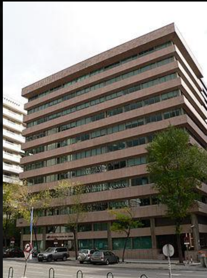
Здание Всемирной Туристской Организации