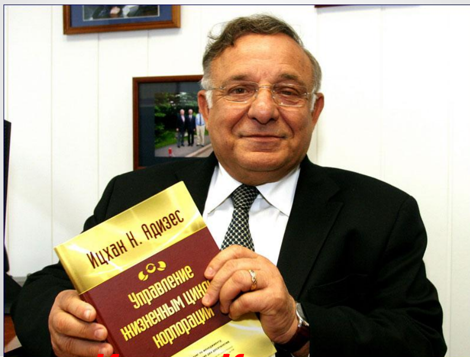
Ицхак Калдерон Адизес

Один из ведущих мировых экспертов в области повышения эффективности ведения бизнеса и правительственной деятельности путем внесения кардинальных изменений, которые не порождают неразберихи и деструктивных конфликтов, препятствующих изменениям.