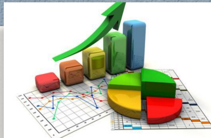
Таблица 3 – Структура товарооборота по товарным группам за 2016 год