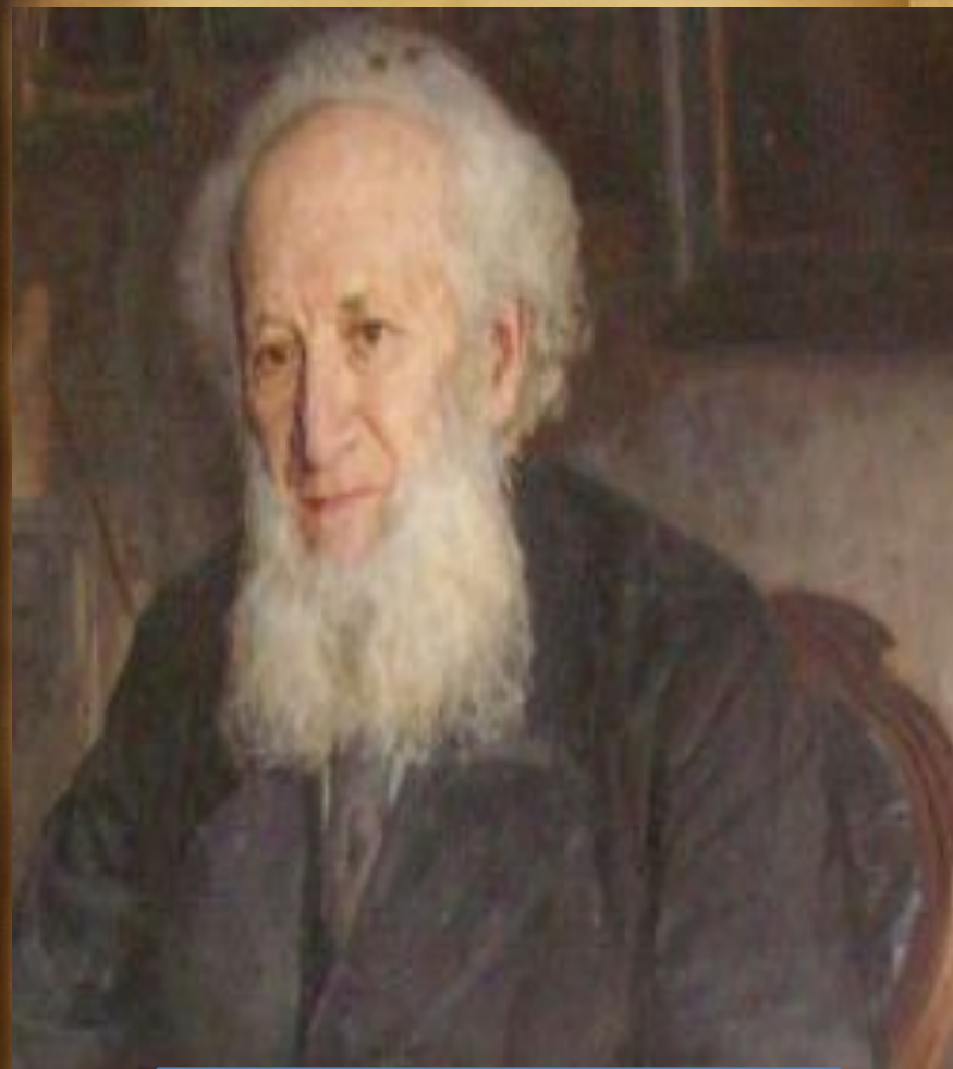
П.П. Семёнов - Тянь-Шанский

ЦСК возглавил П.П. Семёнов - Тянь-Шанский - известный географ, экономист, статист. Под его руководством в 1870 году был проведён первый статистический съезд в России, а в 1872 - Международный статистический конгресс, на котором П.П. Семёнов сделал доклад о принципах организации переписи населения.