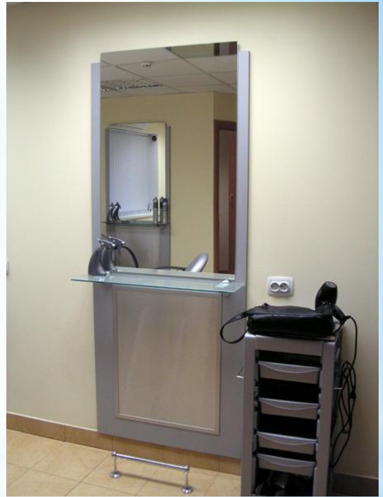
Туалетные столы парикмахерской