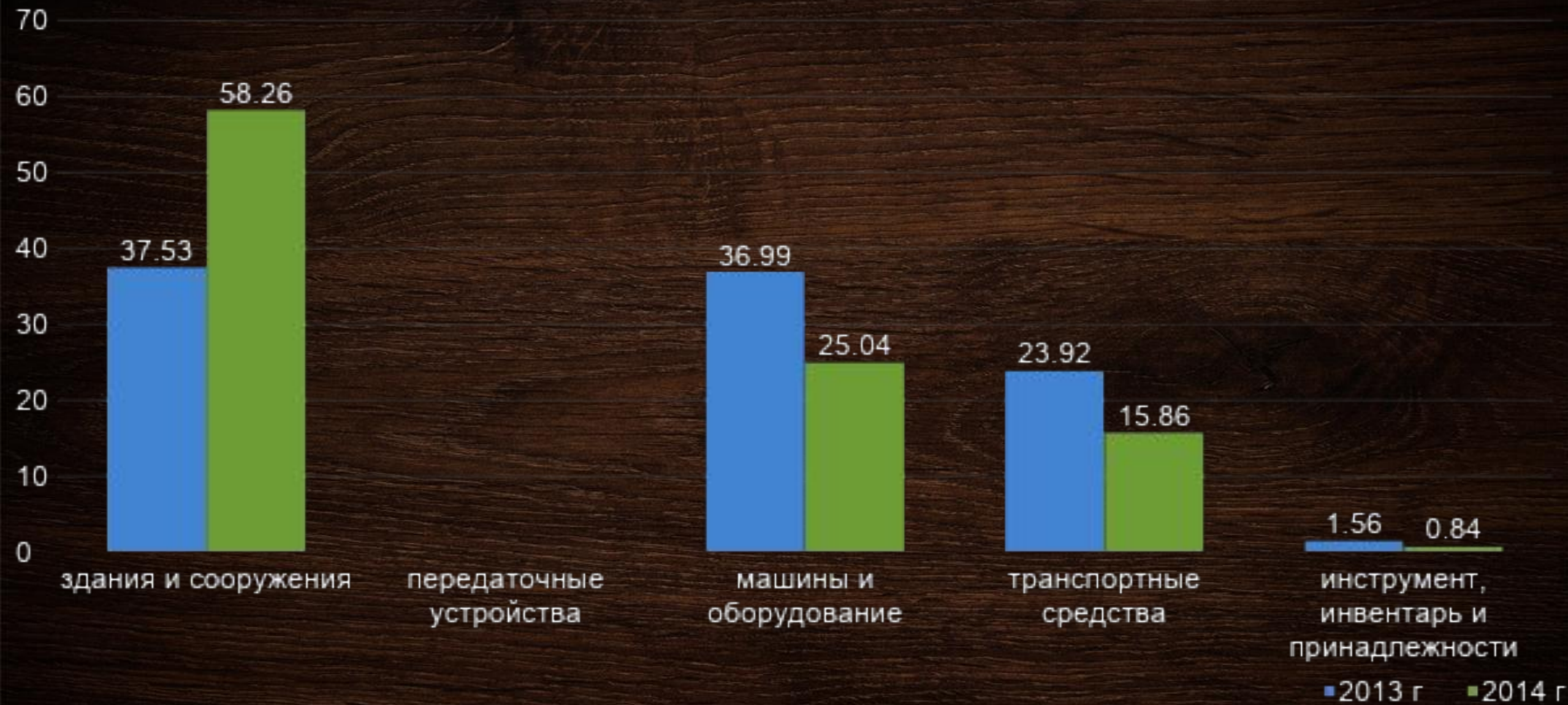
Рисунок 2.1 – Структура основных средств ООО «Сталвиском» за 2013 – 2014 гг.