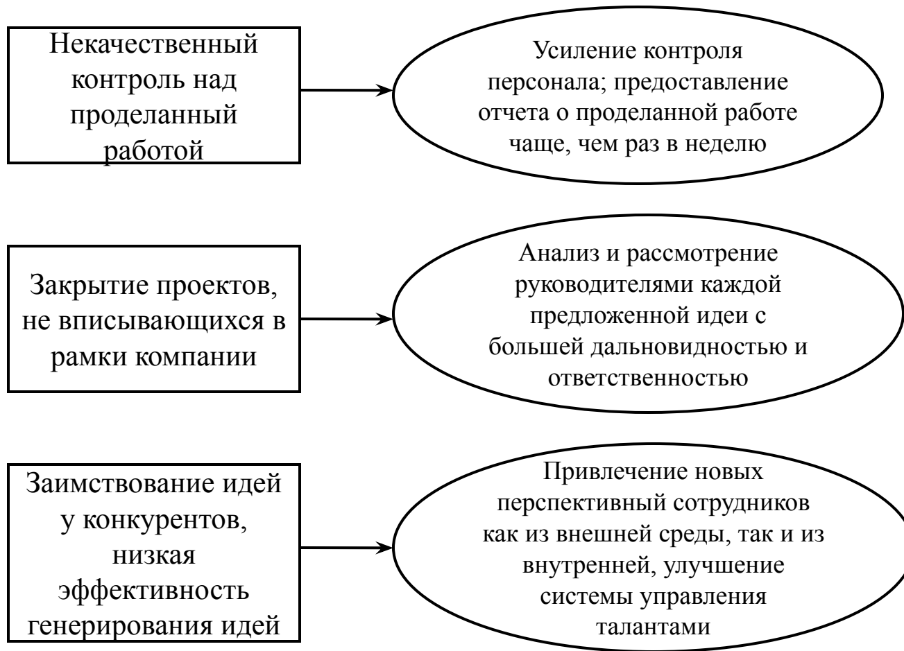
Рисунок 3 – Недостатки в деятельности Google Inc. и способы их исправления