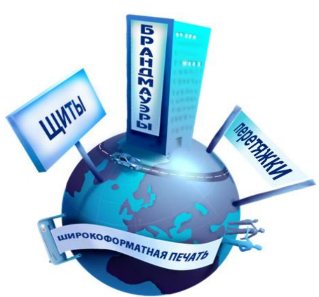
Выбрать средства, места и сроки распространения рекламы