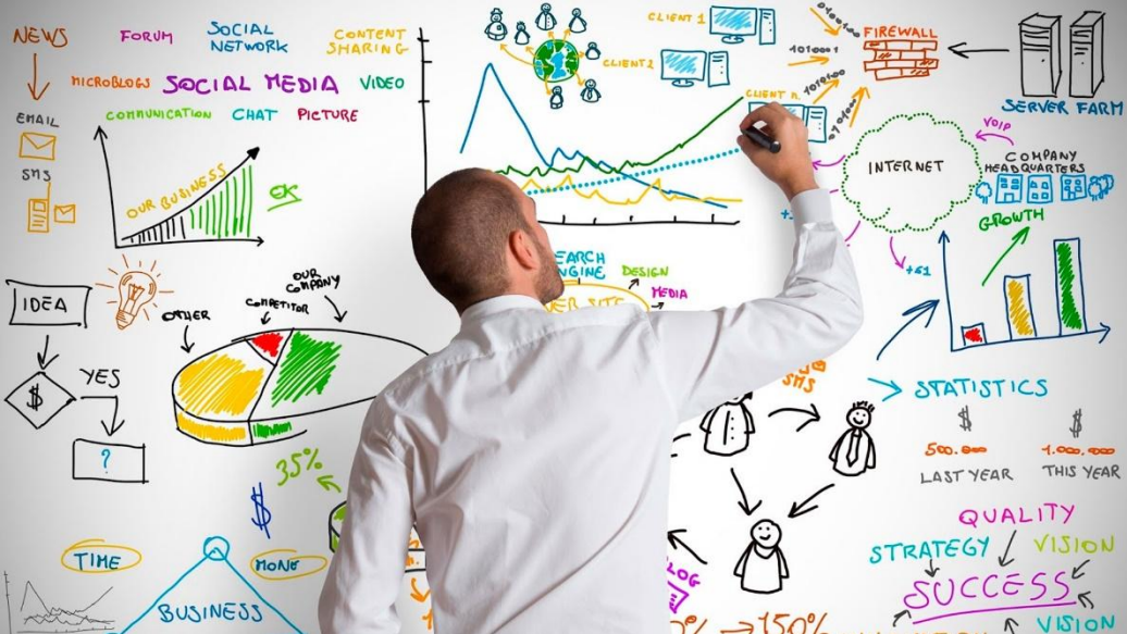
Разработать творческую стратегию