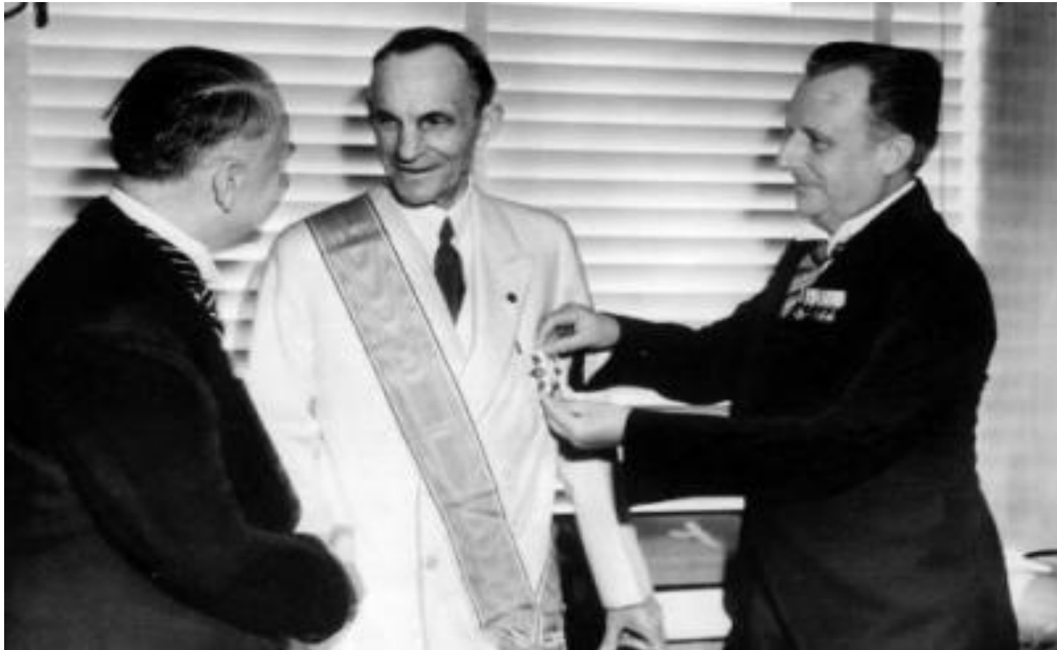
Награждение Генри Форда за вклад в автомобильную промышленность