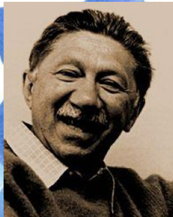
Абрам Маслоу (1908-1970)