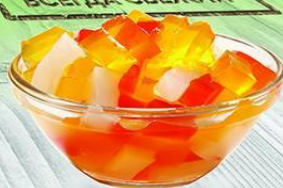
Желе Фруктовое ассорти