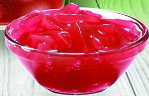
Кусочки кокоса в сиропе