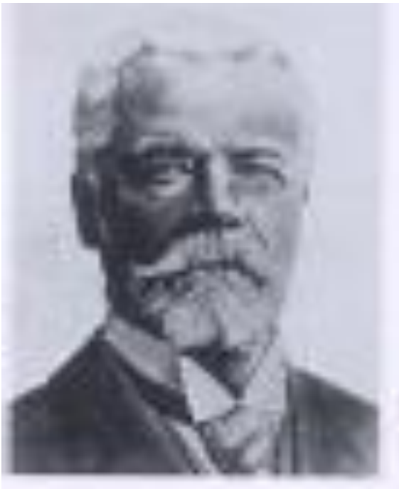
Анри Файоль 1841-1925гг.