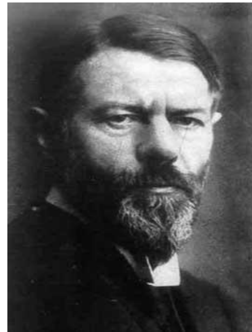
Макс Вебер 1864-1920гг.