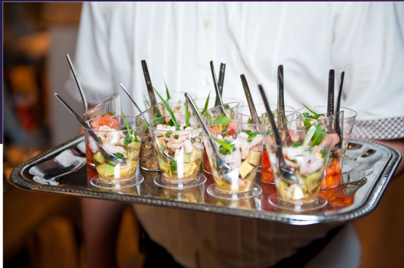
Salātu pildīšana un dekorēšana glāzītēs