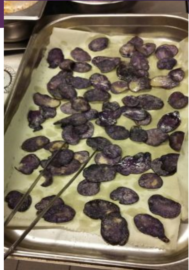
Kartupeļu čipšu fritēšana