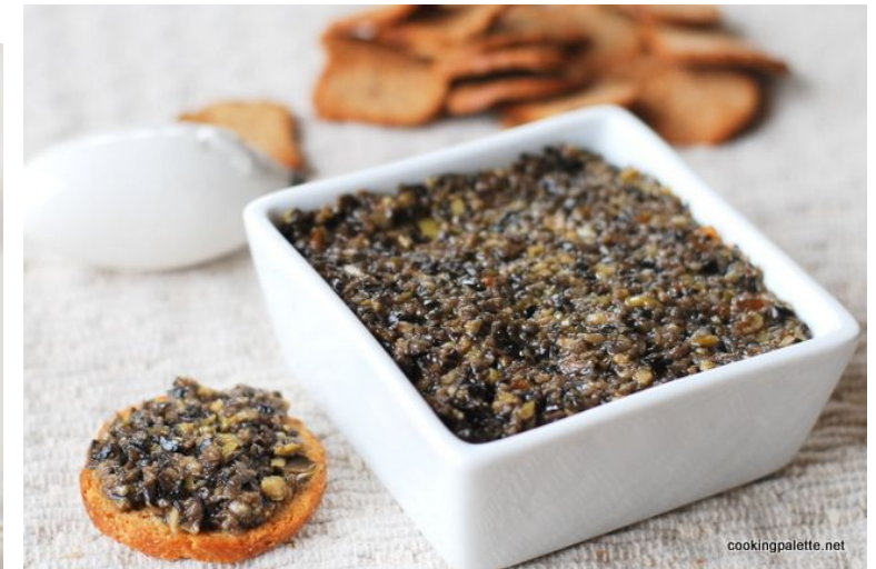
Olīves tapenādes gatavošana priekš kanape