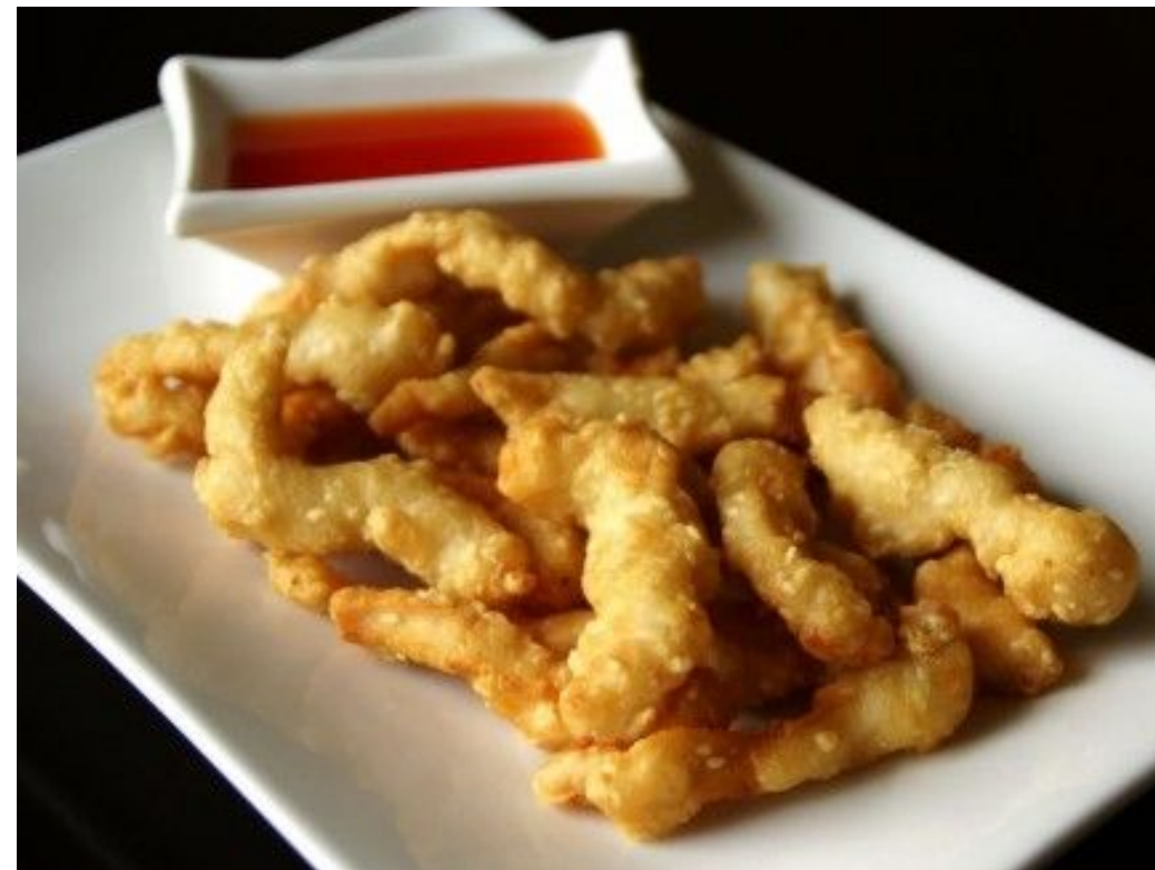
Vistas filejas "tempura" fritēšana