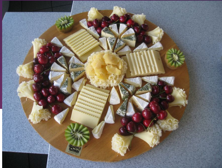
Siera un gaļas plātes veidošana