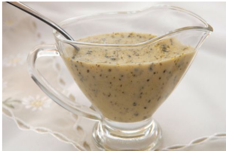
Cēzara mērces gatavošana no majonēzes