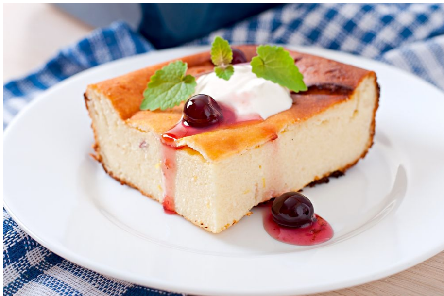
Biezpiena sacepuma pagatavošana cepeškrāsnī