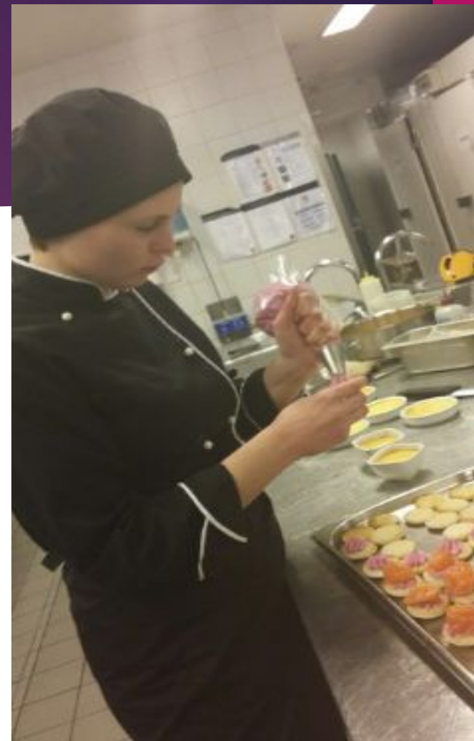
Kanape un uzkodu pagatavošana, dekorēšana