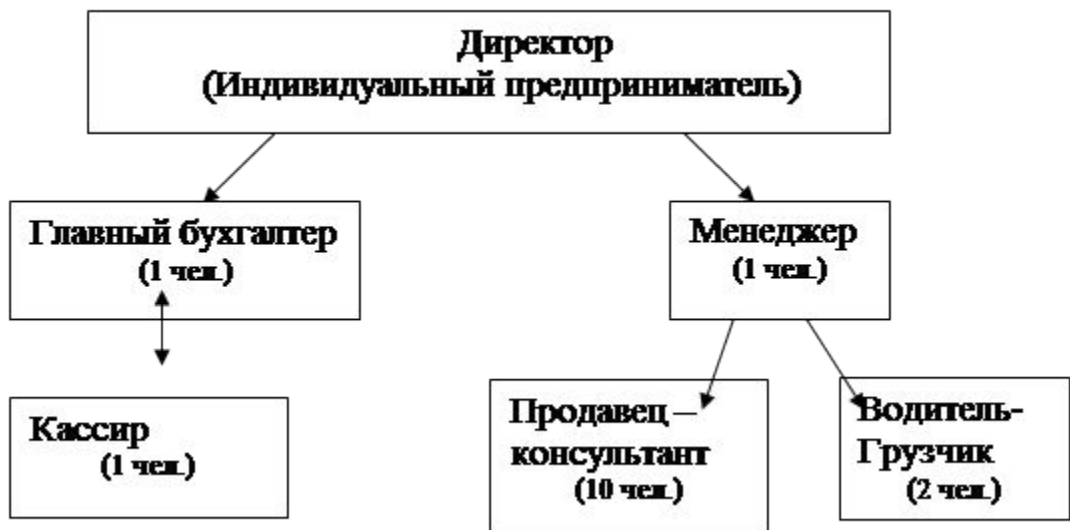
Рисунок 1- Организационная структура ИП Дранникова О.П.