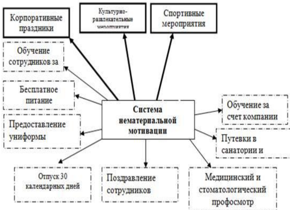
Рисунок 3.1 – Проектные мероприятия по совершенствованию системы нематериальной мотивации персонала в компании.