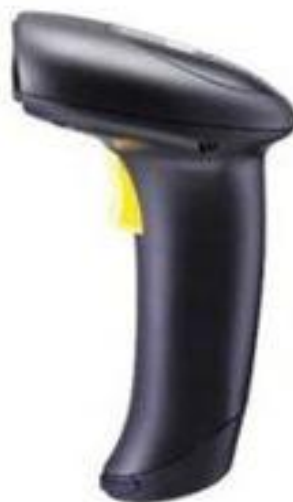
Сканер штрих- кода CIPHER 1564