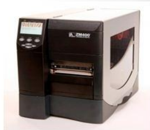
Термотрансферный принтер печати этикеток ZEBRA ZM400