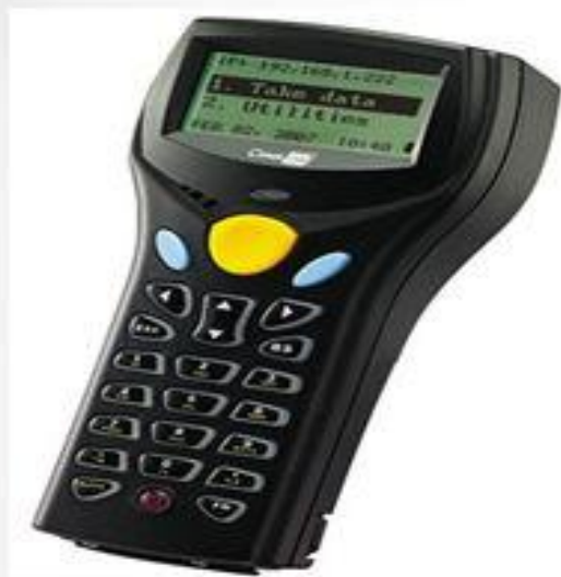
Радиочастотный складской терминал сбора данных Cipher LAB 8330.