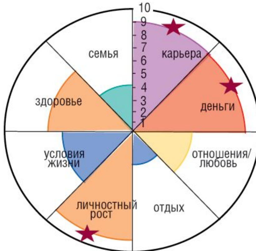
Колесо жизненного баланса