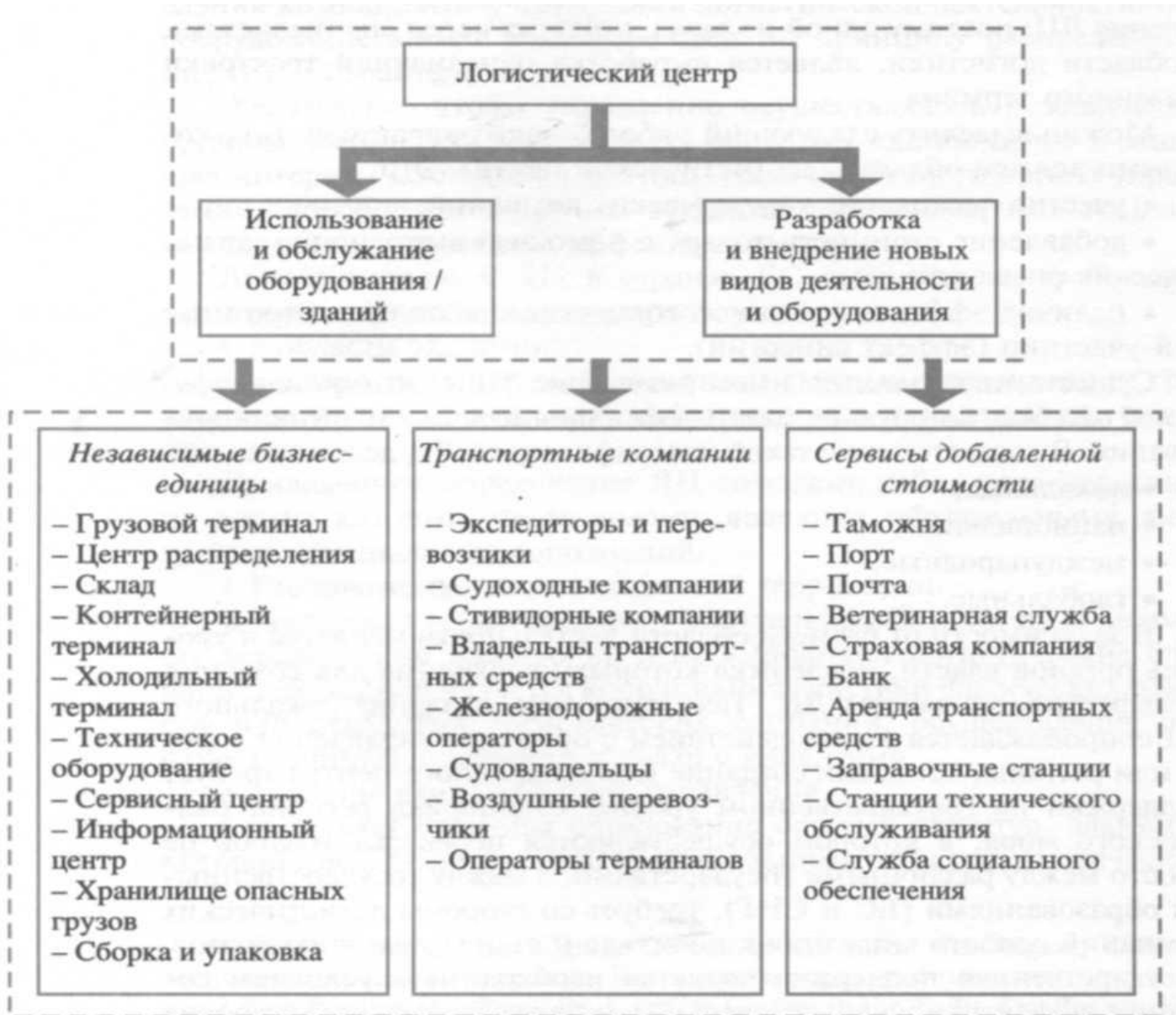
Структура логистического центра