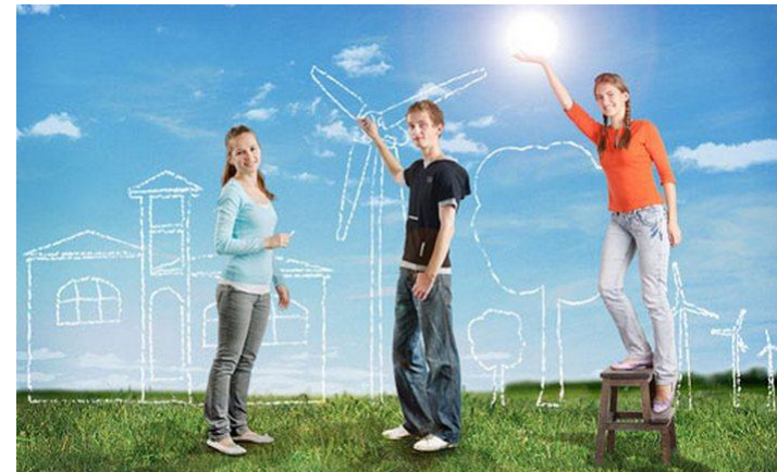
Схема социального проектирования

Проект – это предположительные действия, которые будут совершены в направлении темы проекта. Проект может существовать в любой сфере деятельности человека.