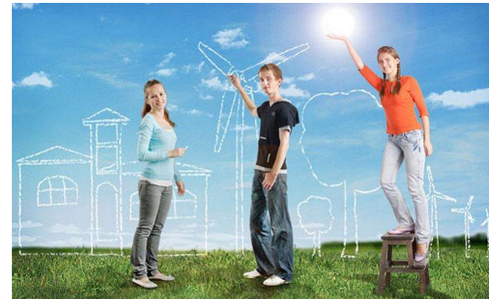
Схема социального проектирования

Проект – это предположительные действия, которые будут совершены в направлении темы проекта. Проект может существовать в любой сфере деятельности человека.