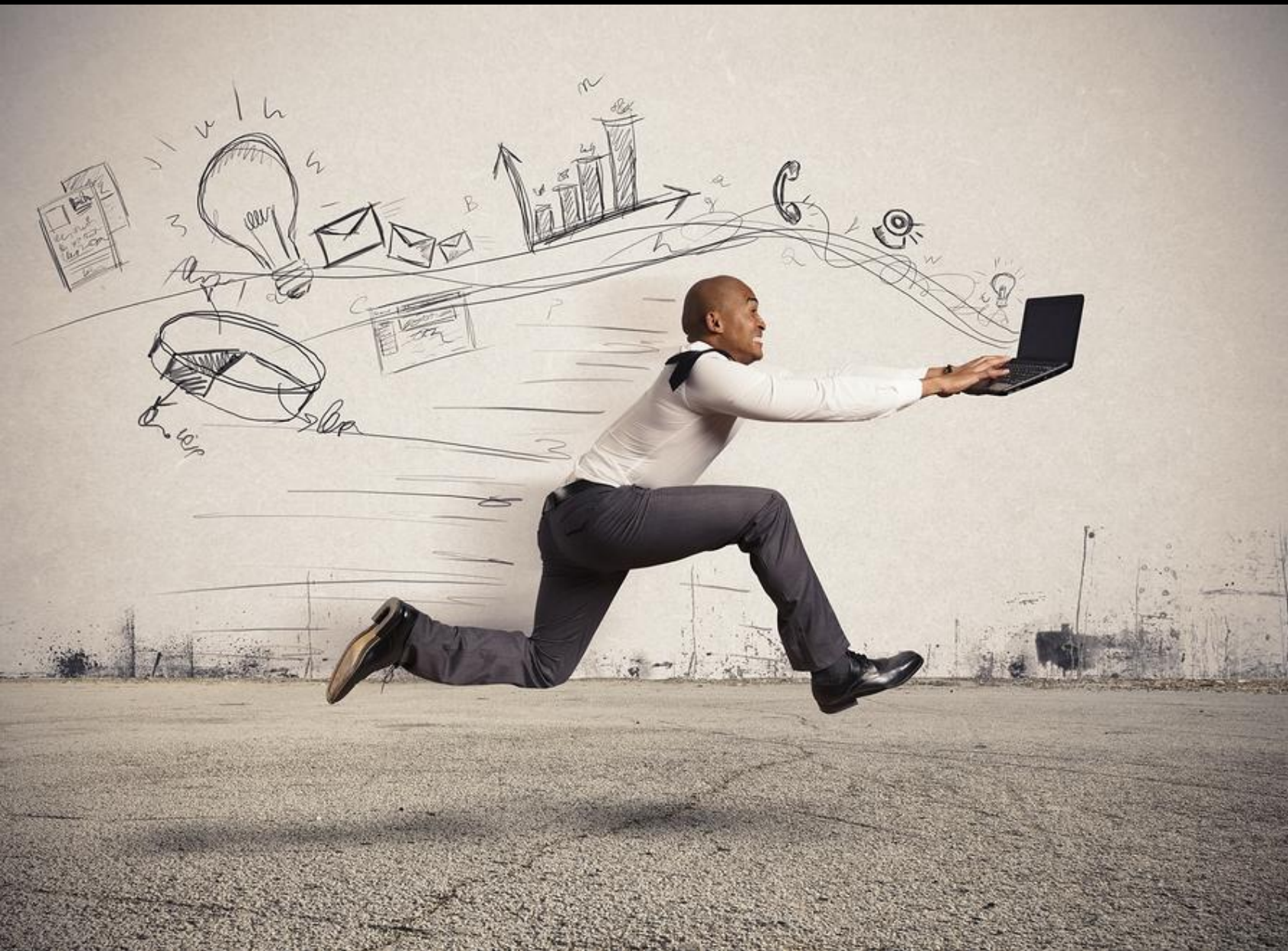
Схема комерційного підприємництва аналогічна схемі виробничої підприємницької діяльності. Відмінність полягає у відсутності в комерційному підприємстві виробництва по випуску продукції та необхідності в зв'язку з цим забезпечувати це підприємство сировиною. Комерційній підприємницькій діяльності передуює аналіз ринку, на основі якого визначаються обсяг і ціна товару, що закуповується, обсяг і ціна реалізації цього товару. Остання має бути вищою за купівельну ціну.