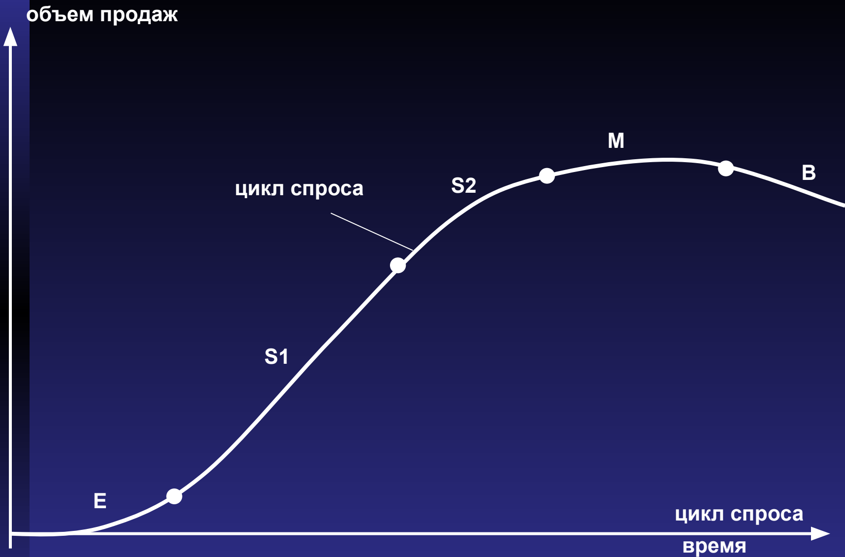
Жизненные циклы спроса и технологий 2