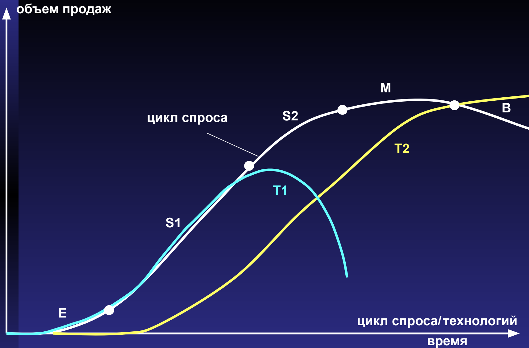
Жизненные циклы спроса и технологий 6