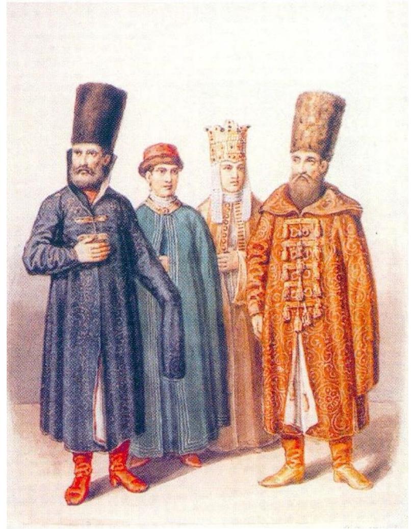
Константин Маковский- «Молодая боярыня»