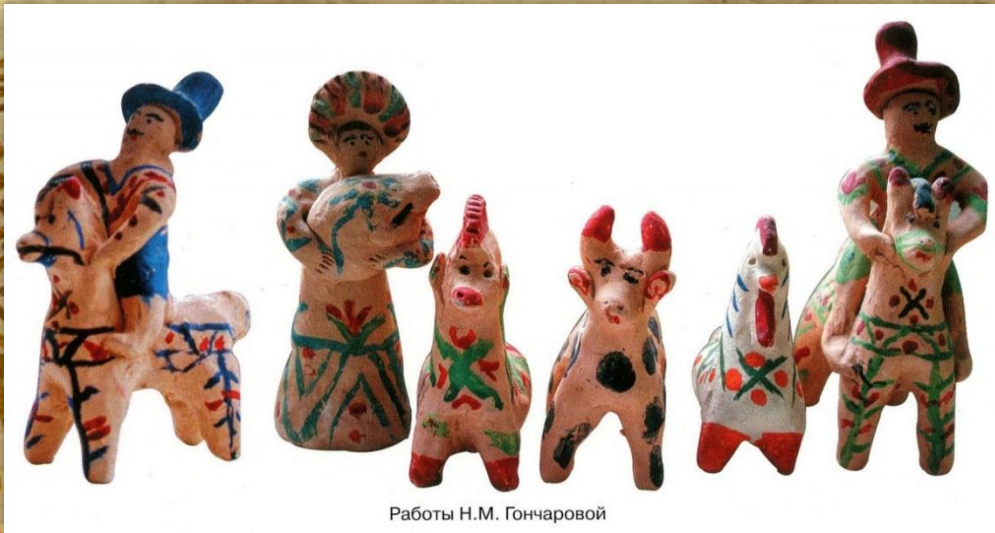
Работы Н.М. Гончаровой

Вот такая она – каргопольская игрушка. История возникновения ее уходит своими корнями в глубокую древность, проходит через века и останавливается в современном Каргополе в Доме-музее династии Шевелевых. Возможно, тот, кто впервые увидит глиняное изделие, скажет: «Такое я и сам сделаю». Но нет, здесь необходимо особое умение, талант, дар. Чтобы создать каргопольскую игрушку, нужно проникнуться крестьянским духом и пропитаться любовью к древнему искусству и своей Родине.