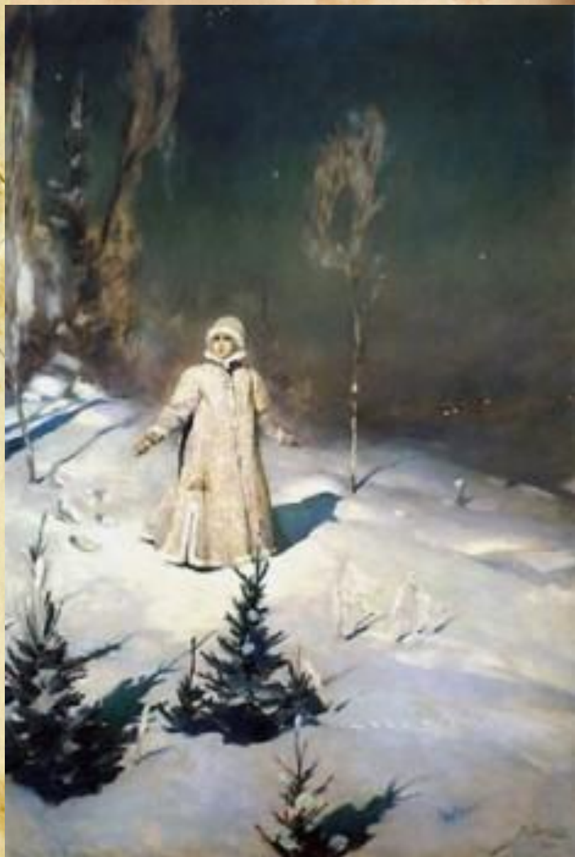
«Снегурочка» 1899 г.