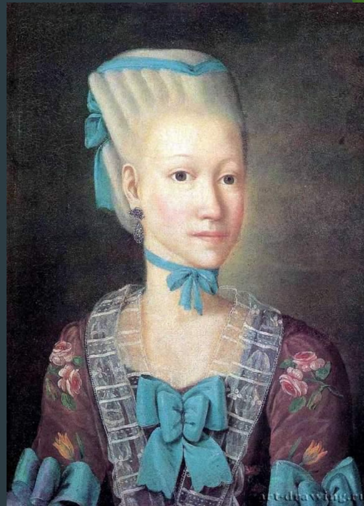
Г. Островский. Портрет Е.П. Червиной. Масло. Россия XVIIIв.

И к концу XVIIIв. Русские живописцы достигли совершенного мастерства.