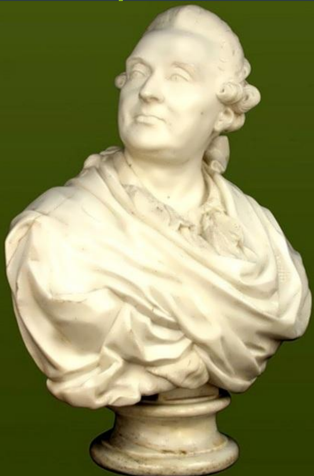
Портрет князя А.М. Голицына. мрамор. Россия. XVIIIв.