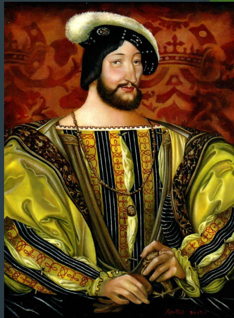
Ж. Клуэ. Франциск I. масло. Франция. XVIв.

В работе художника Жана Клуэ подробно разработанный костюм не мешает нам увидеть лицо короля Франциска I. Благородная сдержанность и бесстрастная величавость сочетается с изяществом и недобрым, упрямым взором.