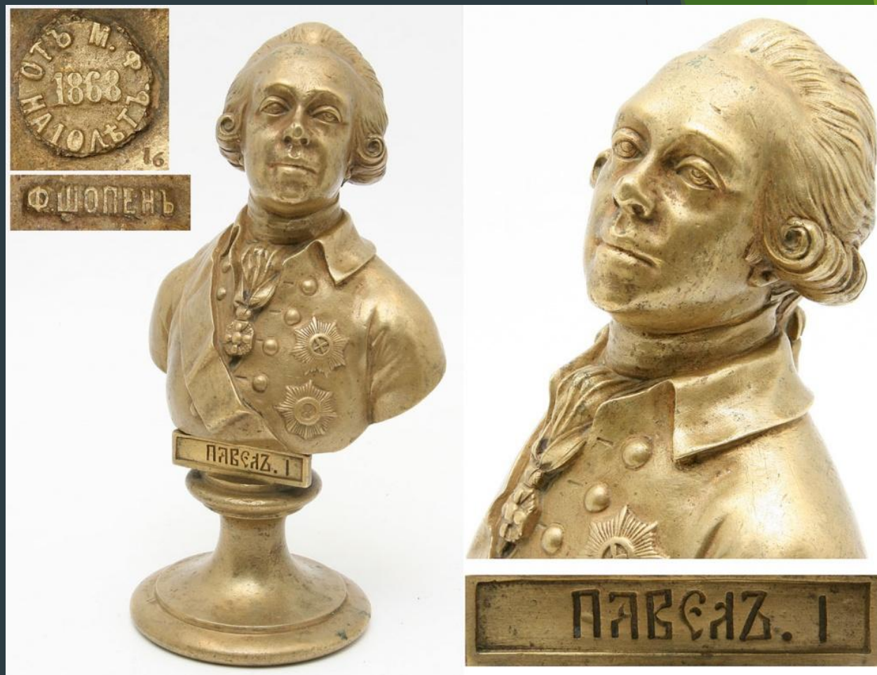
Павел I. Бронза