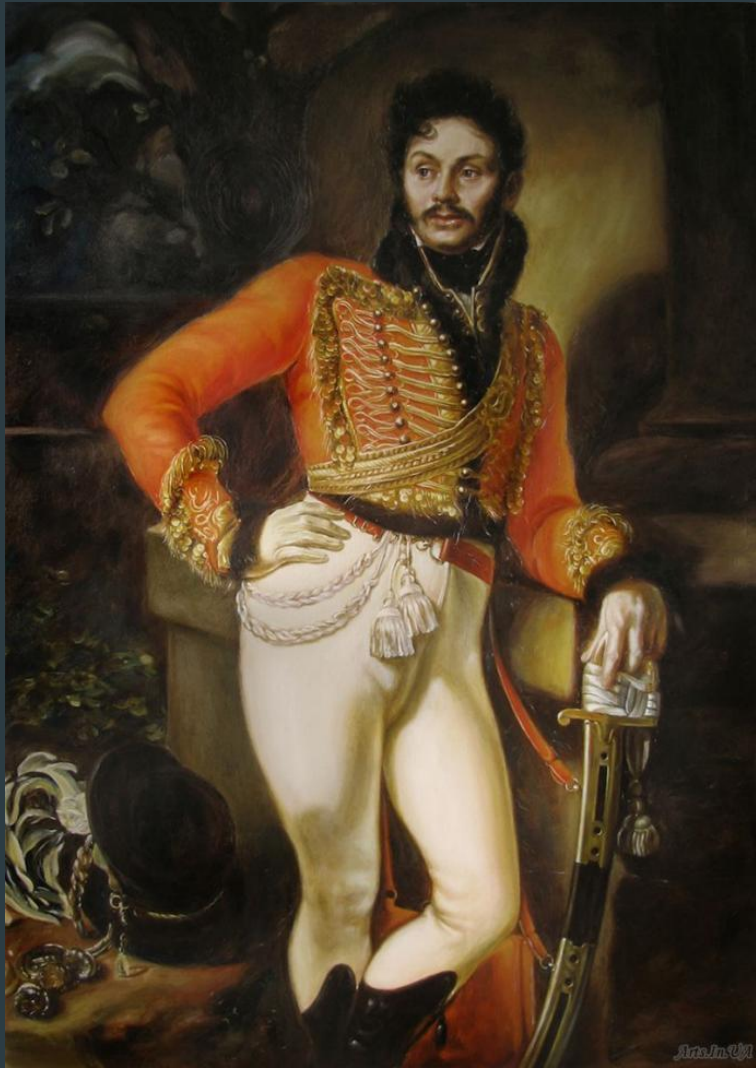
Давыдова. Масло. Россия. XIXв.