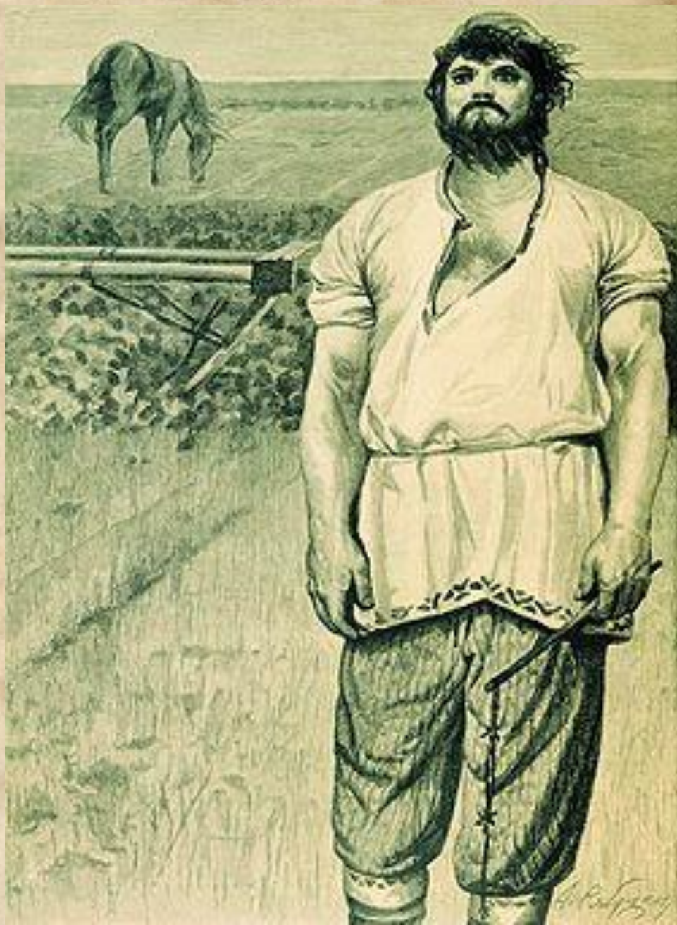
Андрей Рябушкин «Микула Селянинович»

Он говорил: «Кто ж тогда Русь кормить будет?»