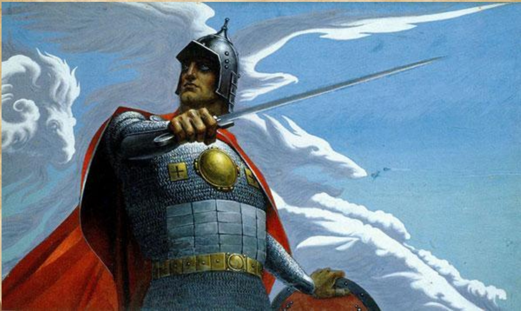
Константин Васильев «Вольга Святославич»