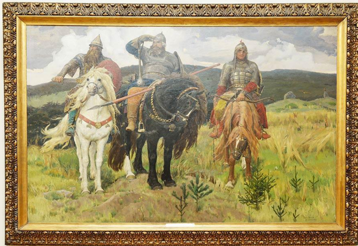
Картина Виктора Васнецова «Богатыри» находится в Государственной Третьяковской галерее