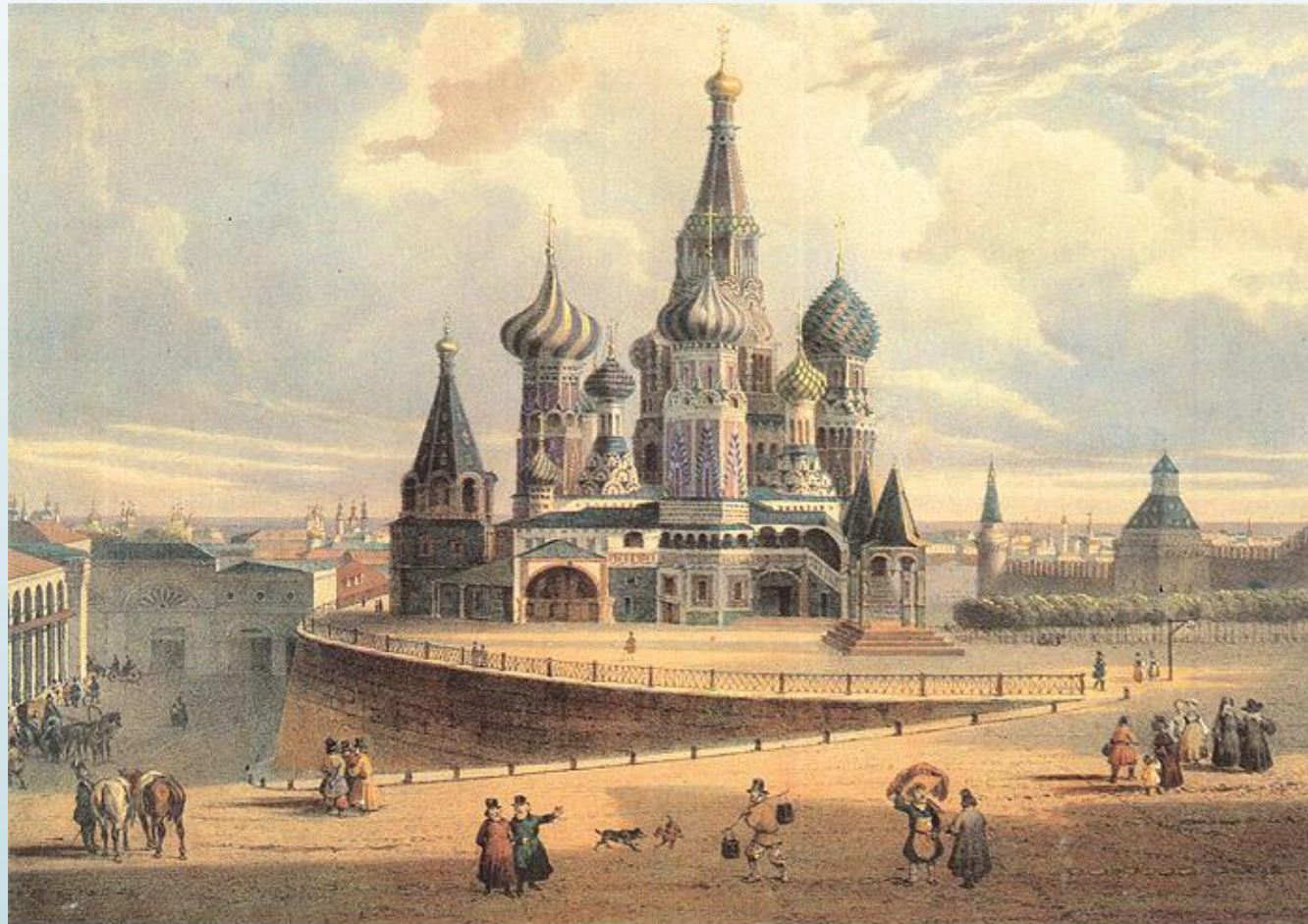
Церковь Василия Блаженного. Литография Бишбуа.