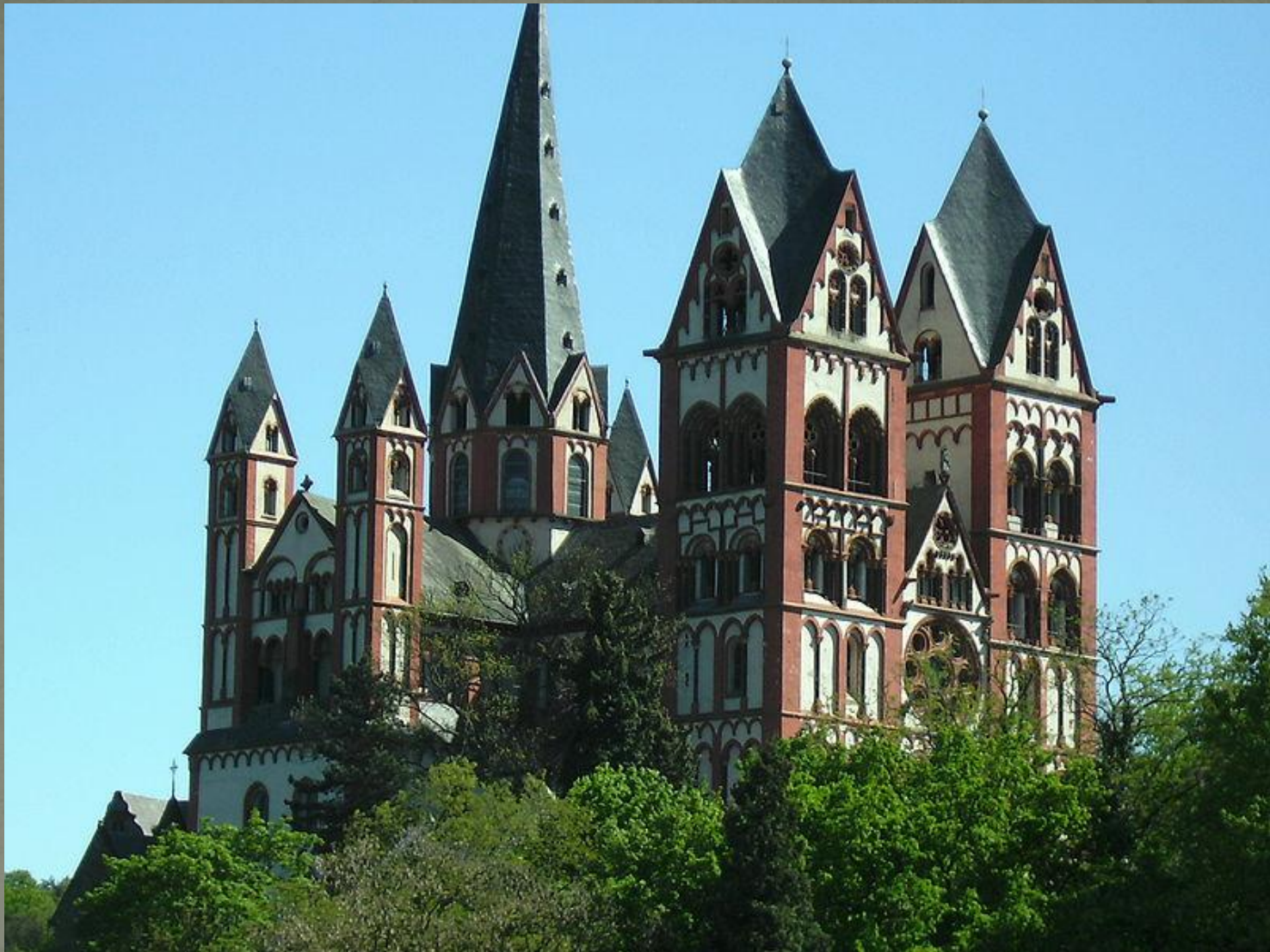
Либмургский собор, Германия