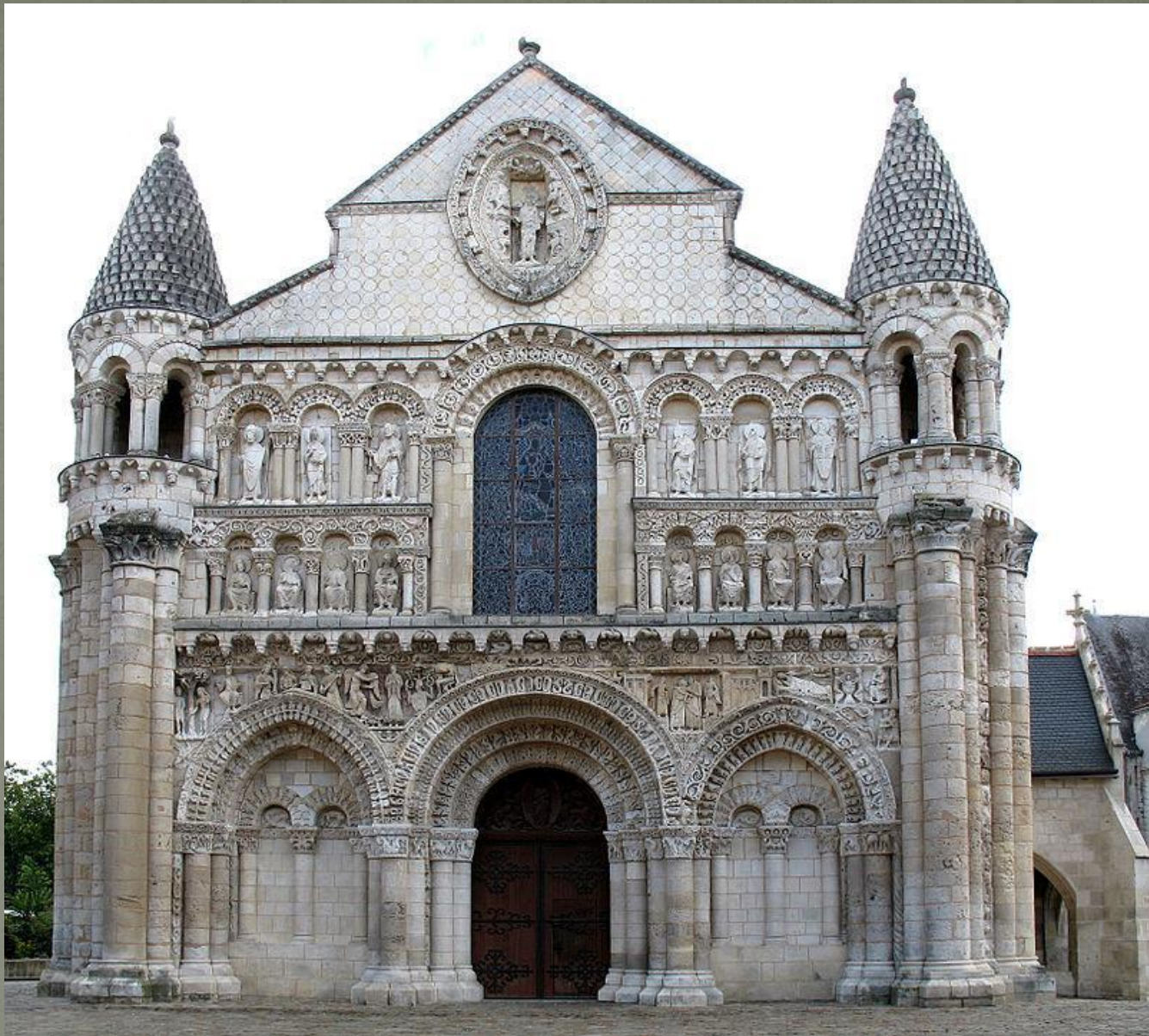
Церковь Нотр-Дам-ля-Гранд, Франция