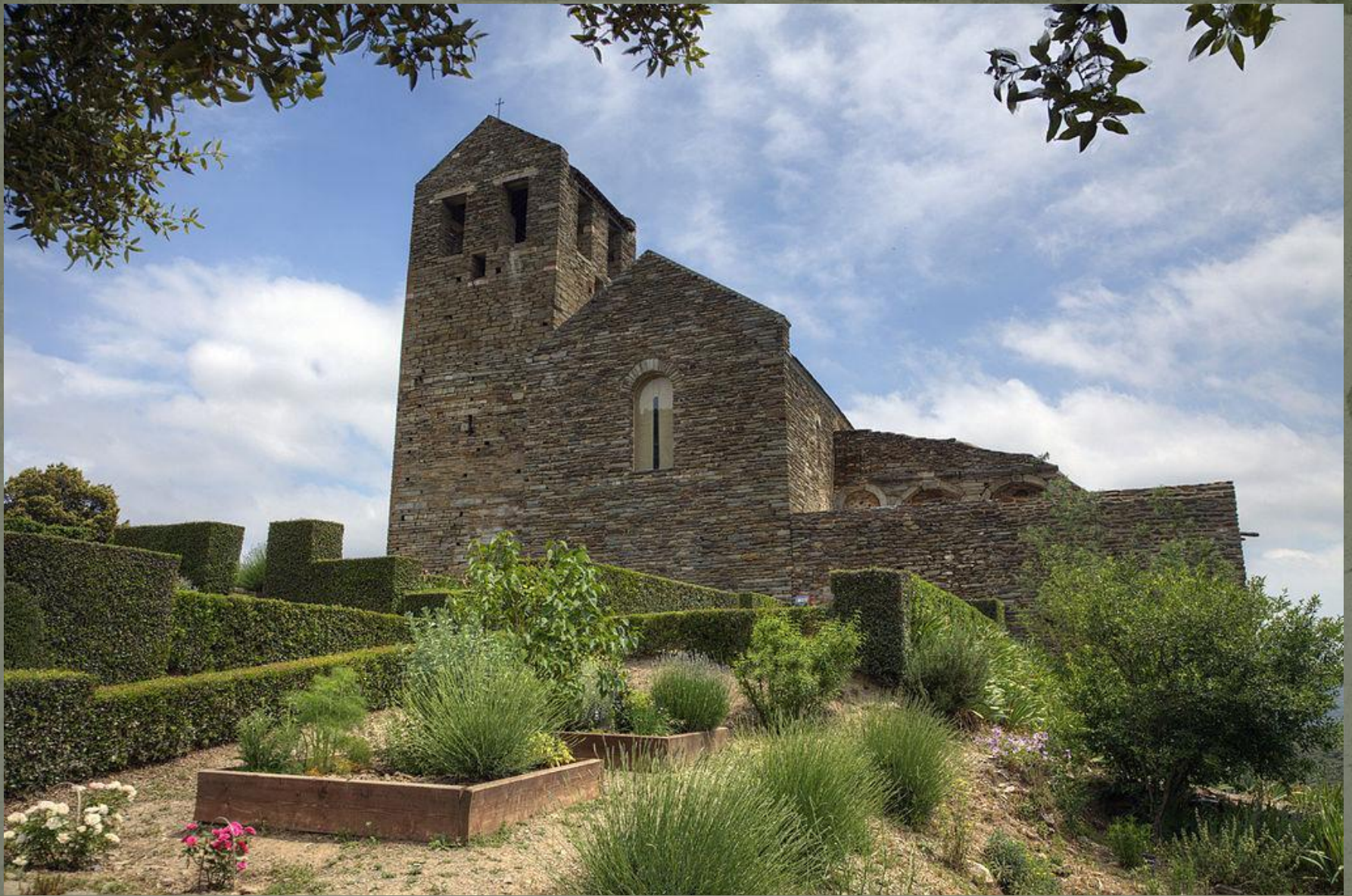
Приорат Серрабоны, Франция