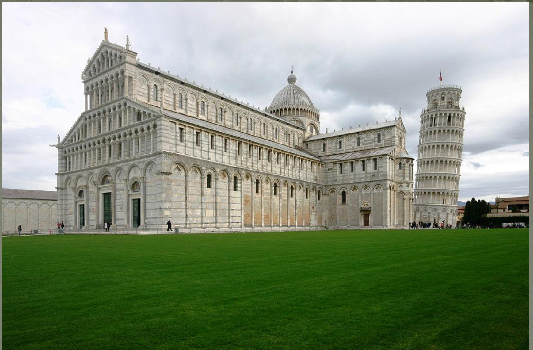
Пизанский собор, Италия