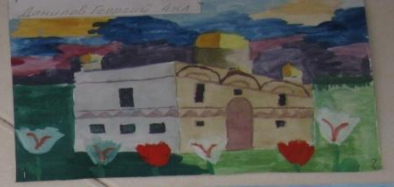
Давыдов Евгений 4 кл.