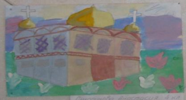
Попарова Анастасия 4 кл.