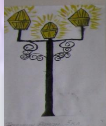
Федосеев Роман 3 кл.