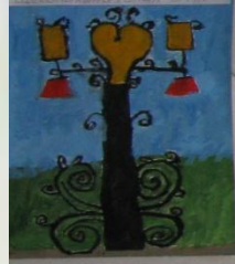
Шевченко Юлия 3 кл.