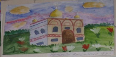
Попарова Анастасия 4 кл.