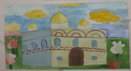
Рыжова Валерия 4 кл.