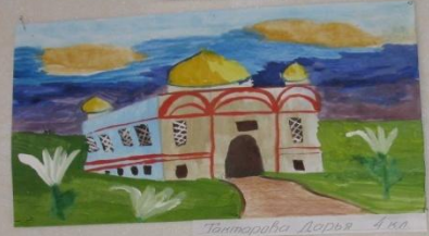
Попарова Дарья 4 кл.