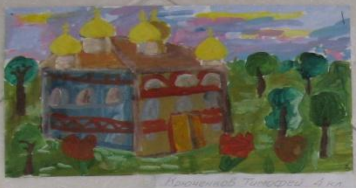
Попарова Анастасия 4 кл.