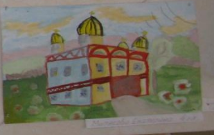
Полынов Роман 4 кл.