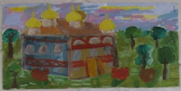
Полынов Роман 4 кл.