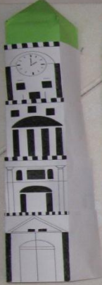
Шевченко Илья 3 кл.