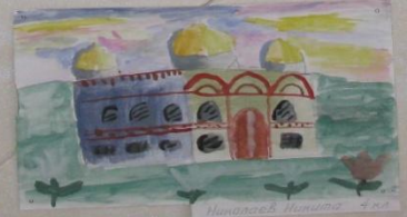
Полынов Роман 4 кл.