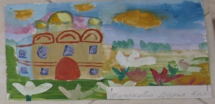
Кудрякова Дарья 4 кл.