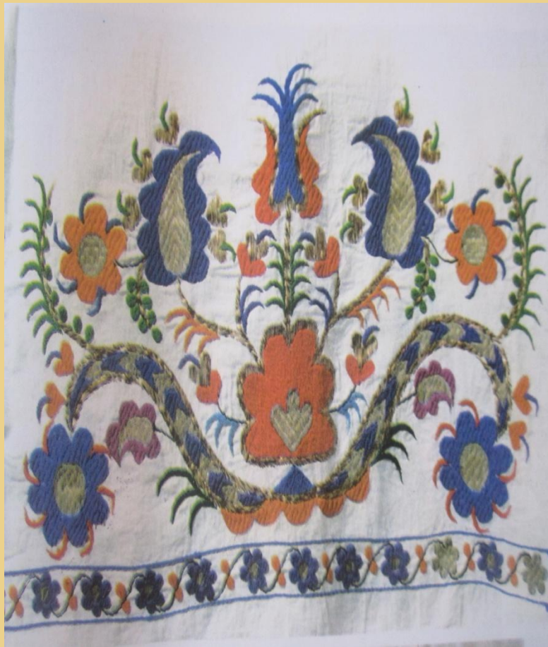
Эвджыяр XIX асыр

Ресим басмагъа кечирильмеден эвель, къатты картон къагъыттан ресим къалыбы япыла, сонъра исе бу къалып басманынъ орьнек чекиледжек ерине къоюла ве этрафы къарандашнен сызыла, сонъ орьнек нагъышлана эди.