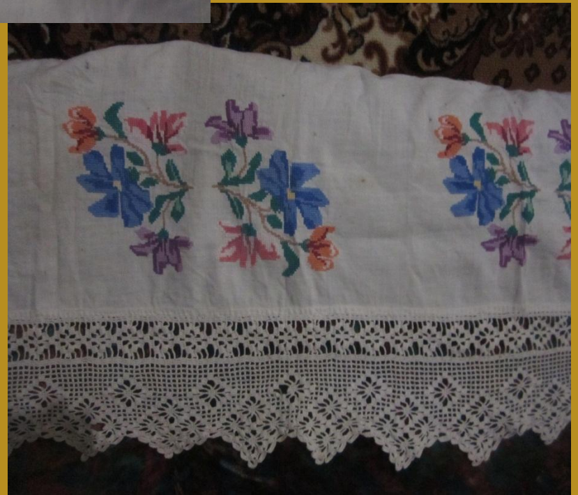
Къартанамнынъ нагъышлы пешкири