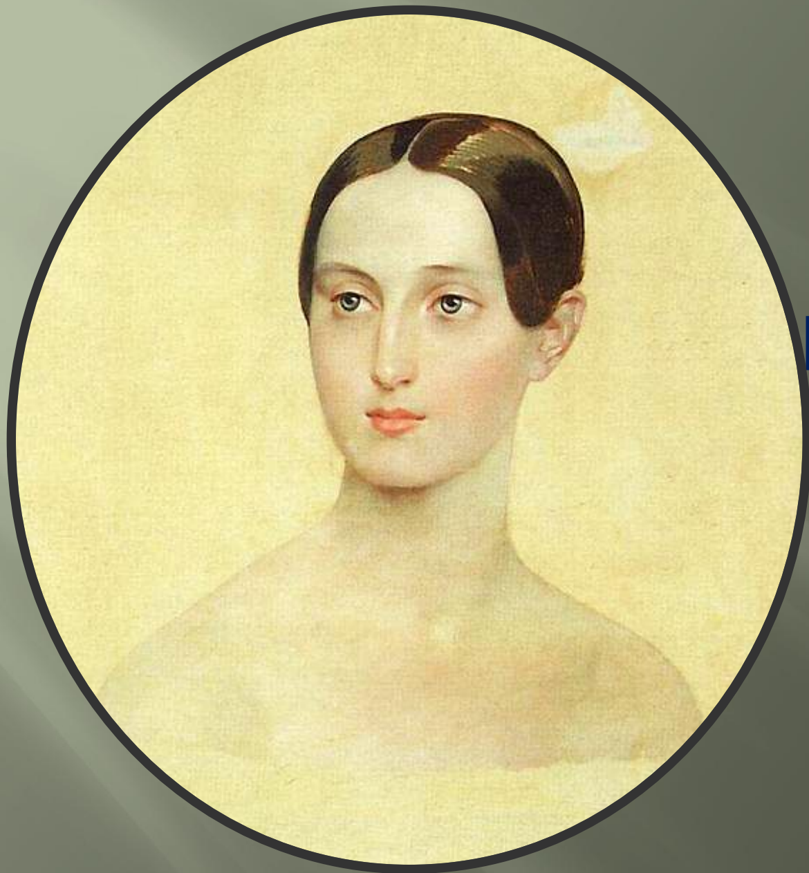
Портрет Вел. княжны Марии Николаевны 1837 г