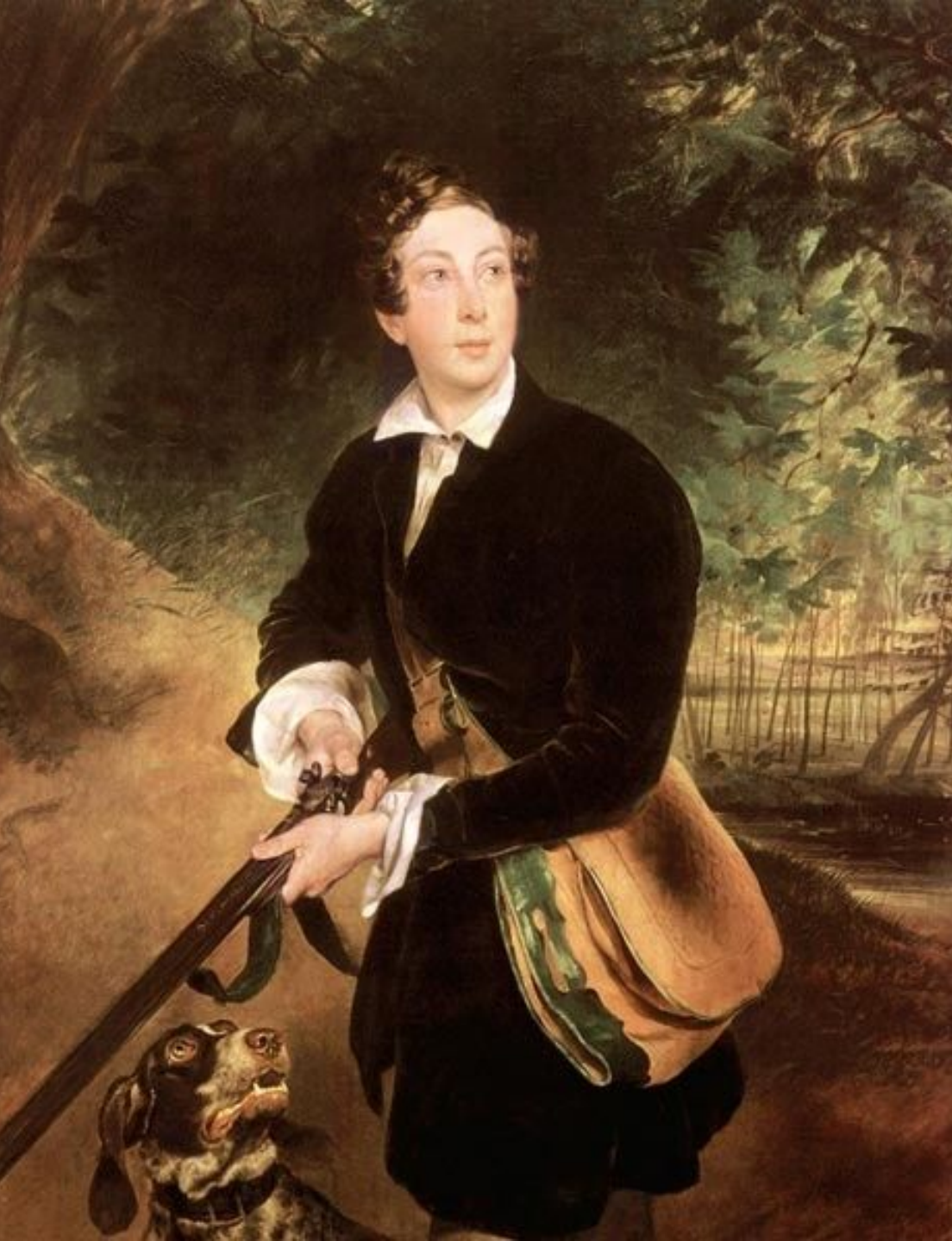
Портрет графы А.К. Толстого