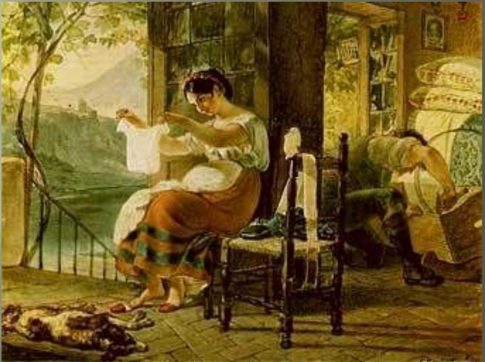
Итальянка, ожидающая ребенка.