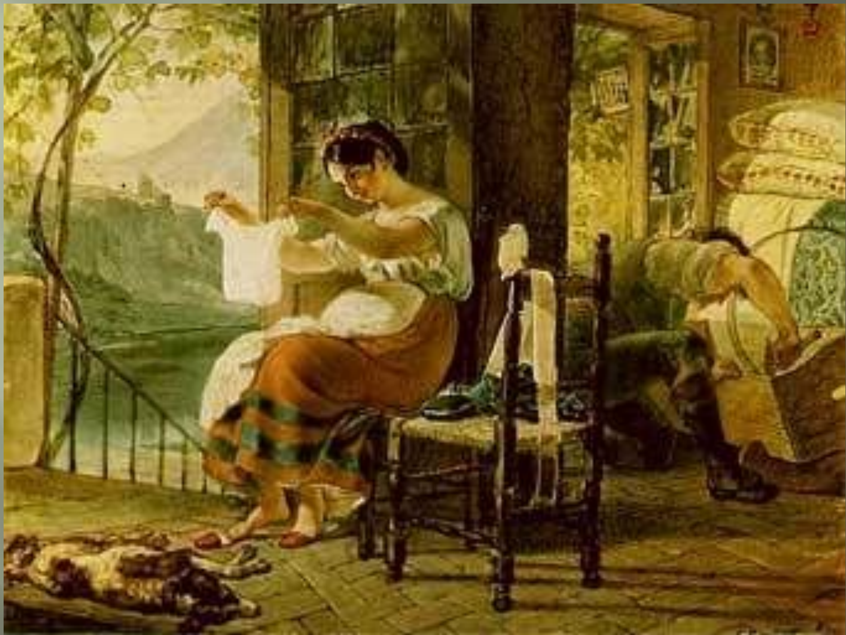
Итальянка, ожидающая ребенка.