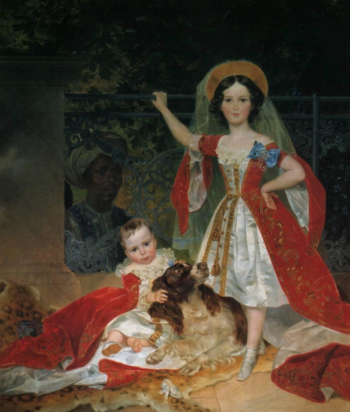
Портрет детей Волконских с арапом