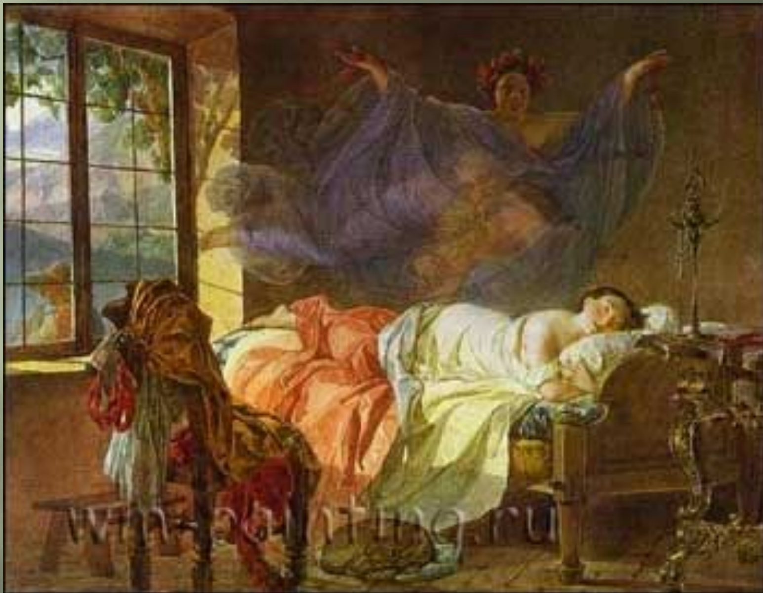
Сон девушки перед рассветом