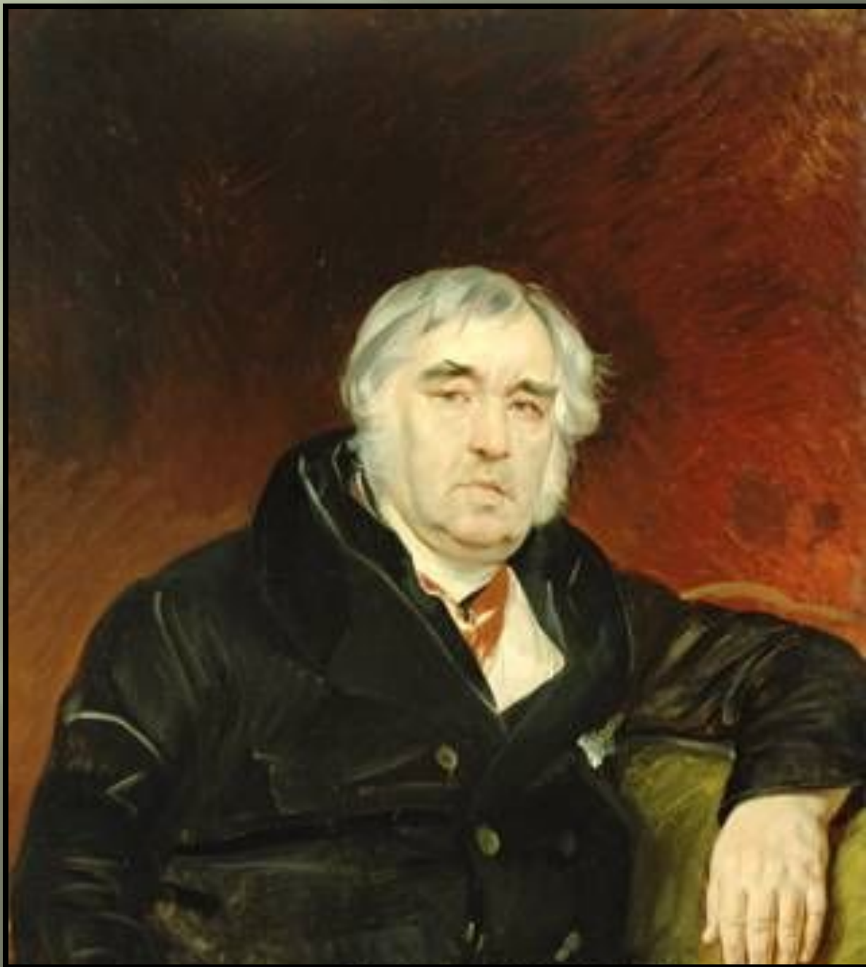
Портрет И.А. Крылова 1839