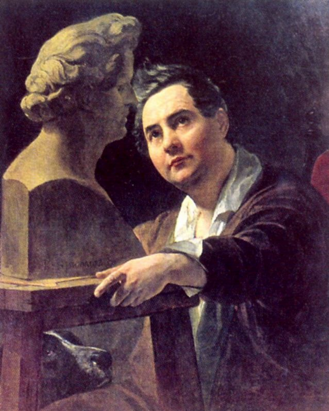
Портрет скульптора И.Витали 1837