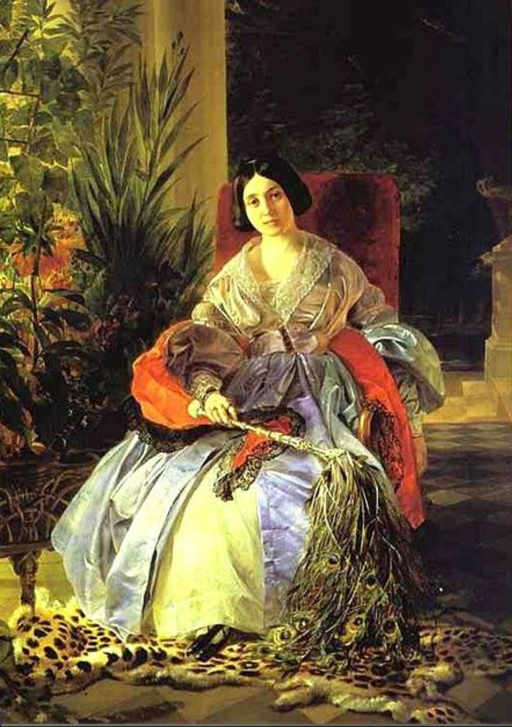
Портрет княгини Елизаветы Павловны Салтыковой.