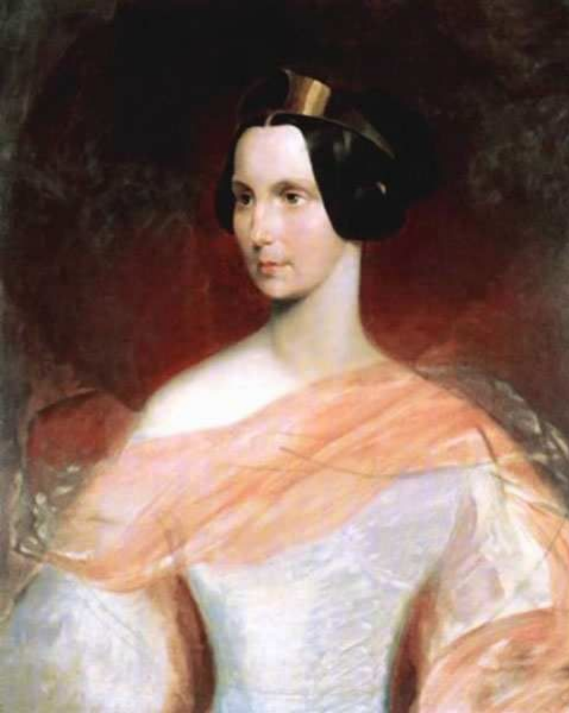
Императр. Александра Федоровна