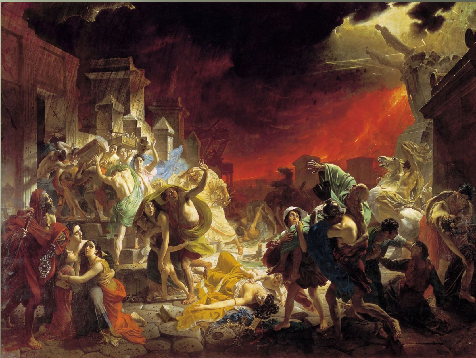
Последний день Помпеи