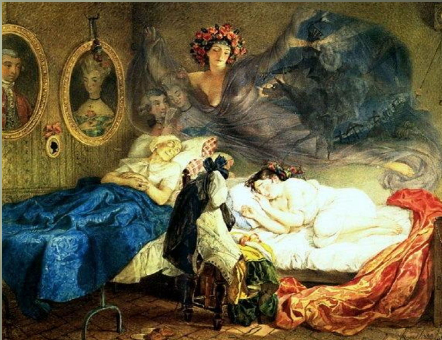
Сон бабушки и внучки