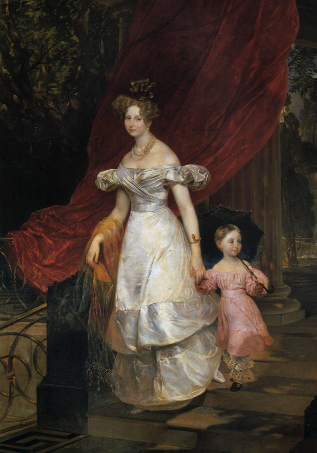
Портрет великой княгини Елены Павловны с дочерью