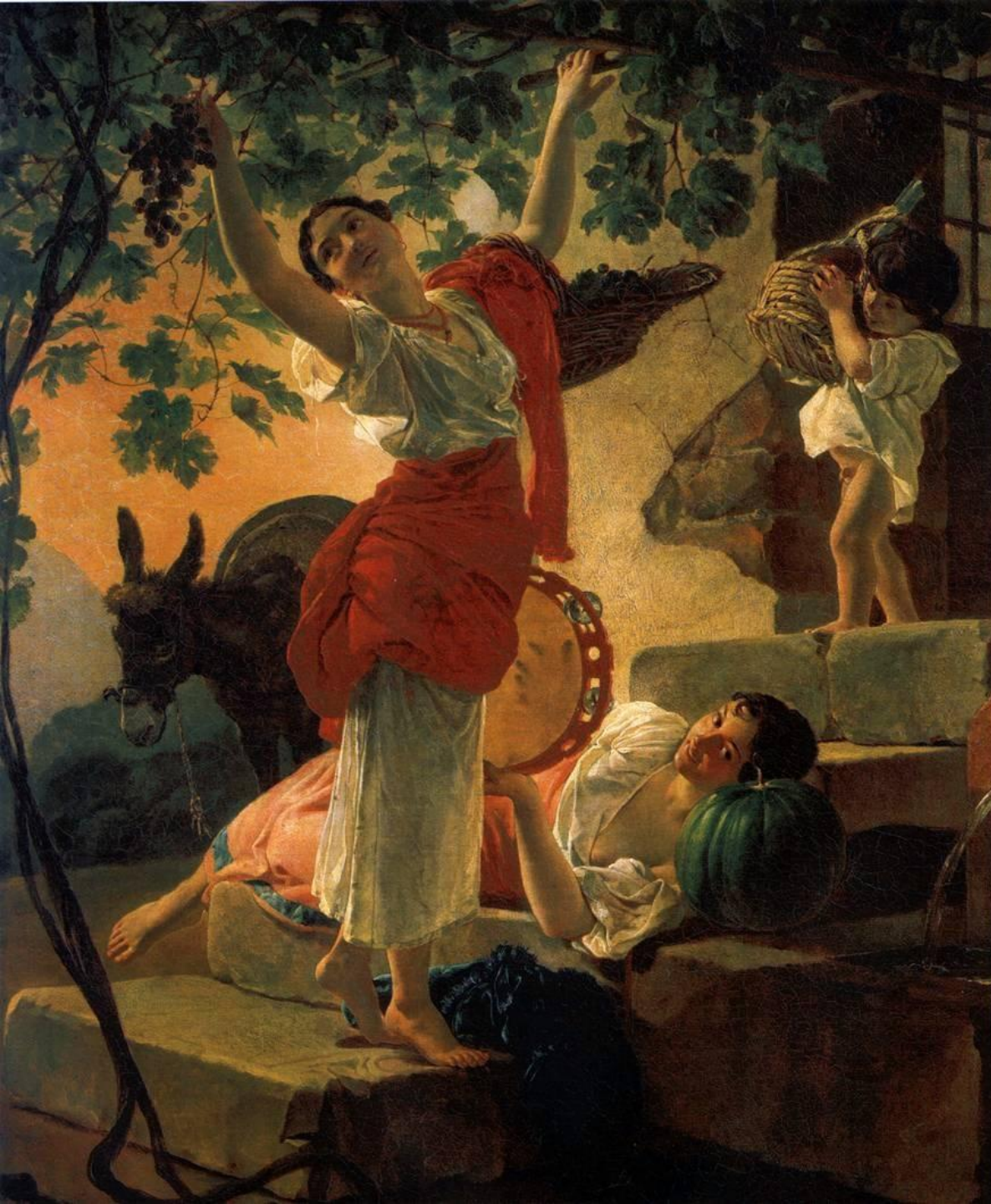
Девушка собирающая виноград в окрестностях Неаполя