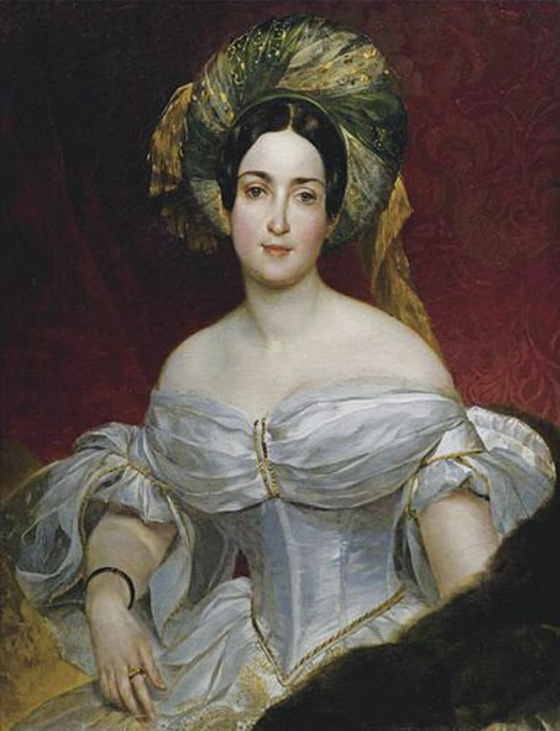
Портрет княгини Авроры Демидовой