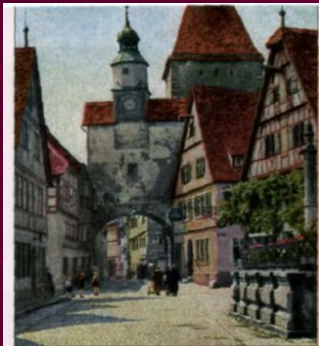
Исторический (вверху) и деловой центры города

Центр – особое место «сердце города», которое имеет своё лицо, свою атмосферу, неповторимость.