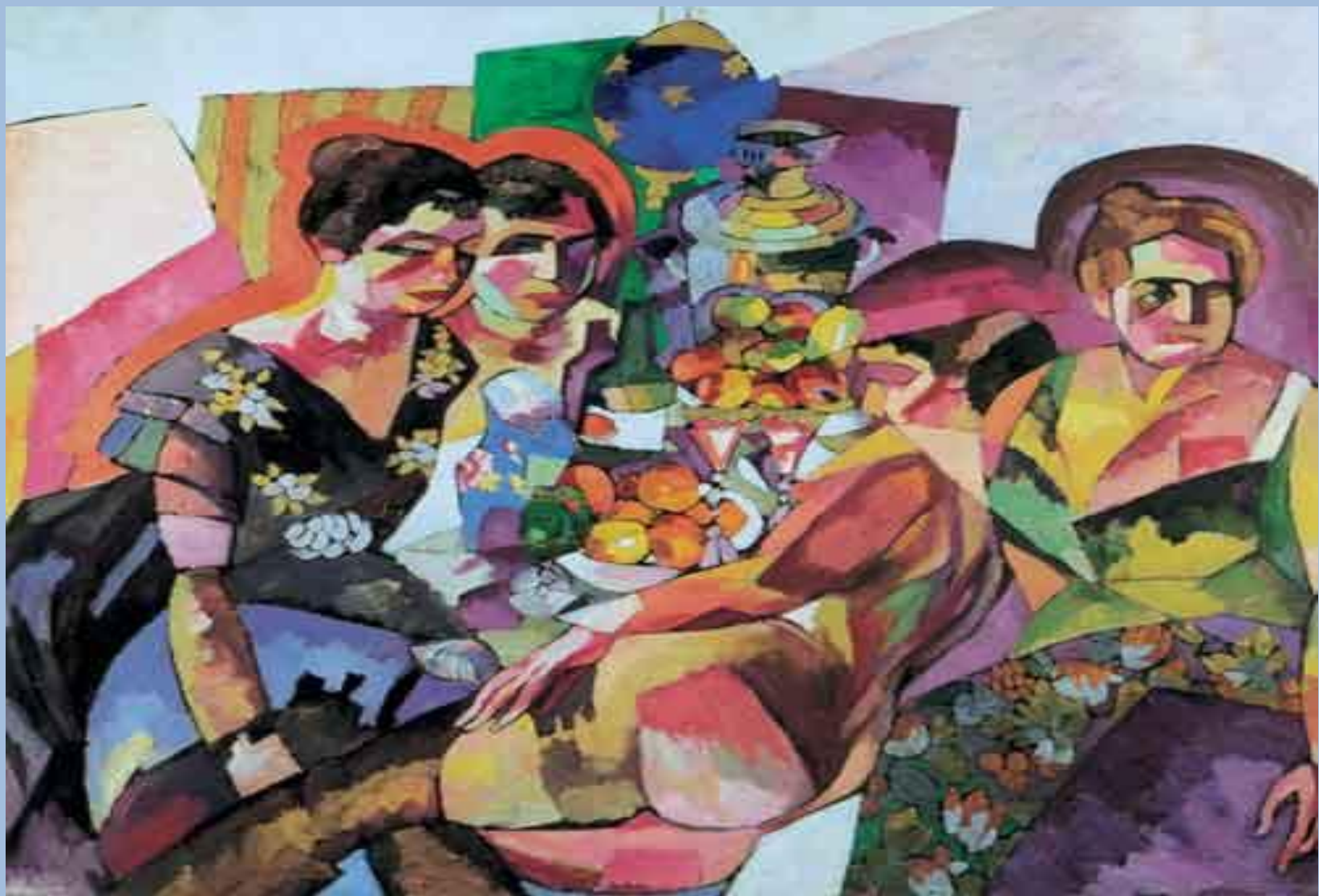
Аристарх Лентулов. Женщины и фрукты. 1917