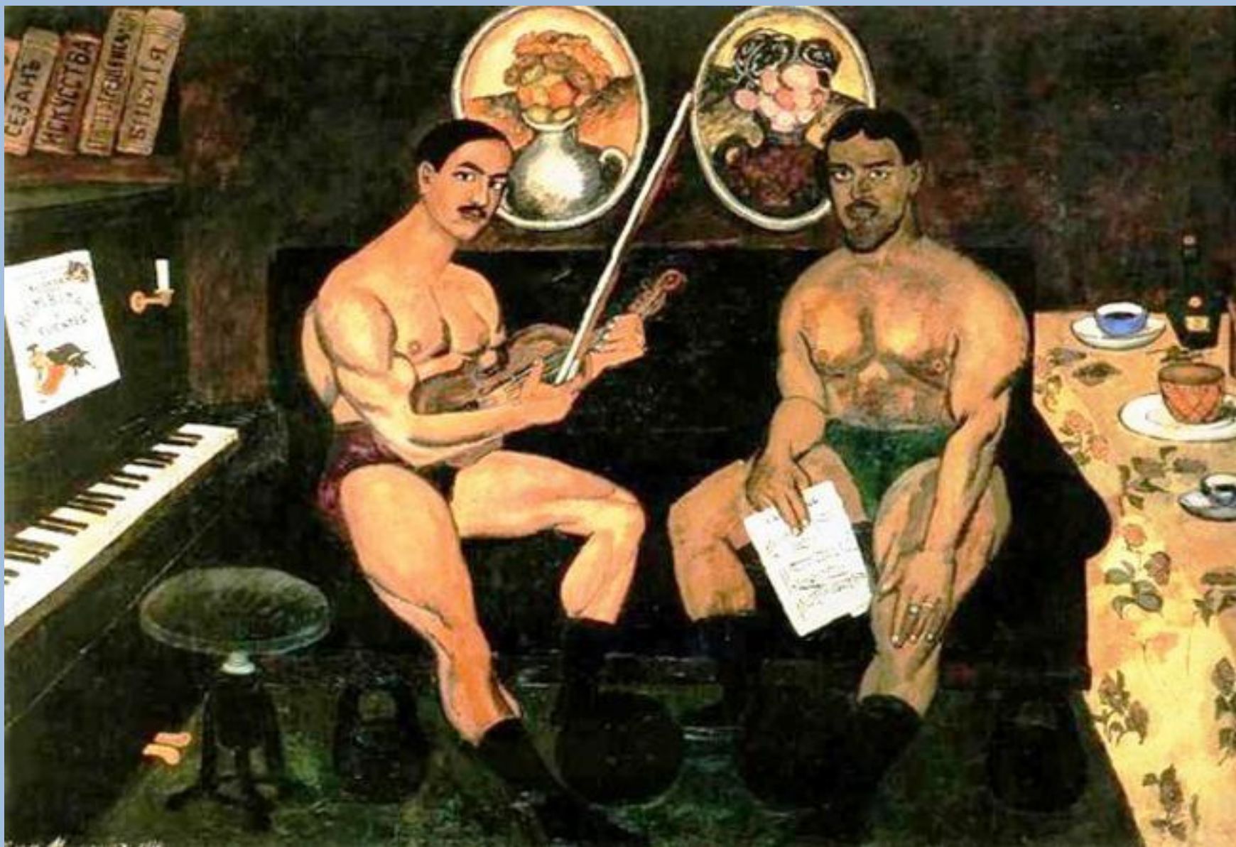
И.Машков. Автопортрет и портрет Петра Кончаловского.1910 год