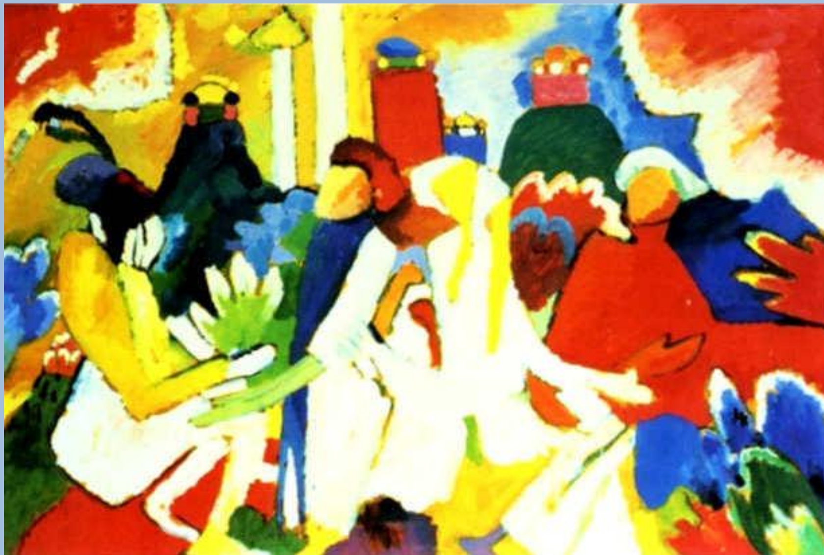
Василий Кандинский. Восточное. 1909