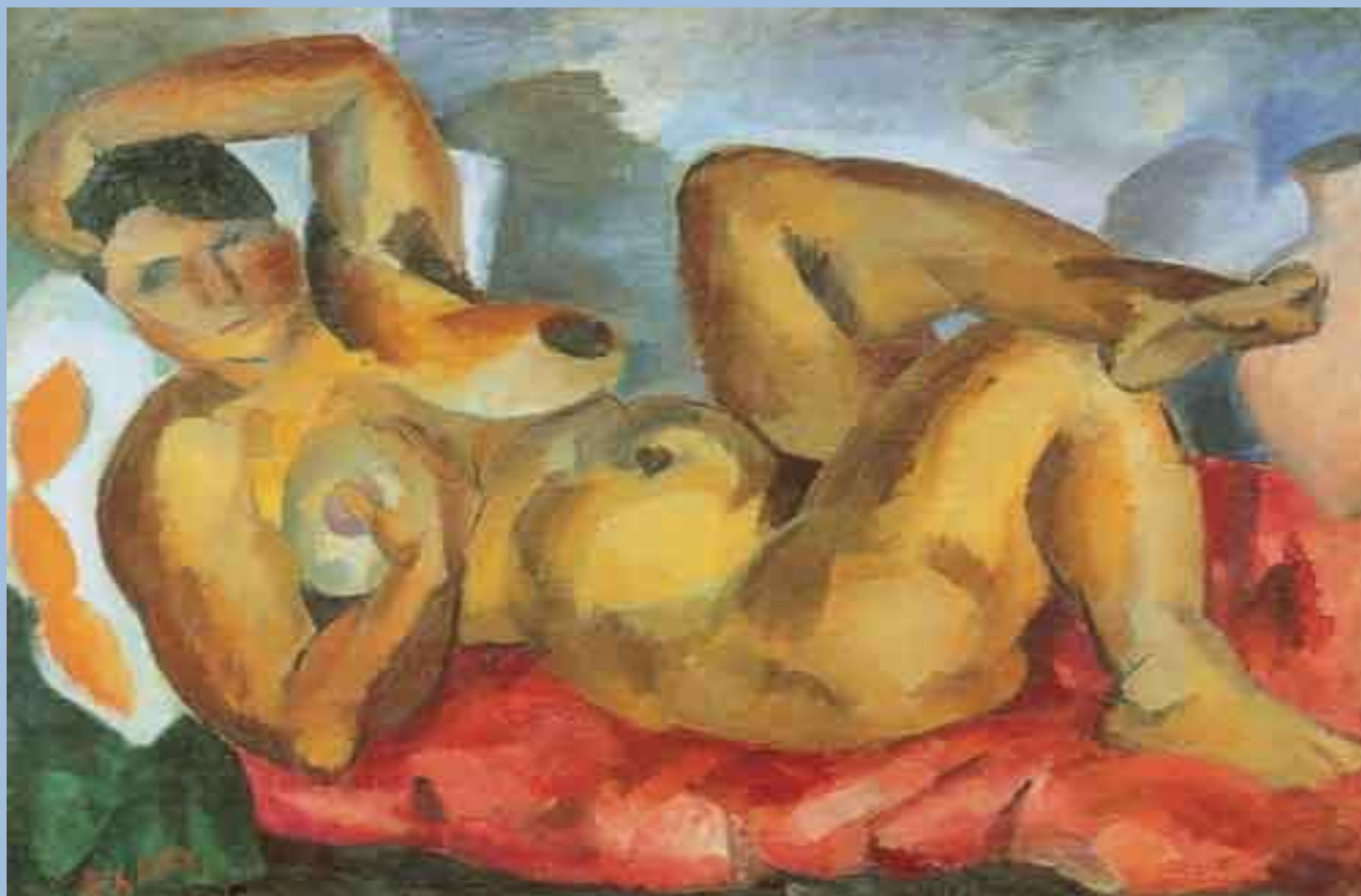
Роберт Фальк. Обнаженная. Крым. 1916