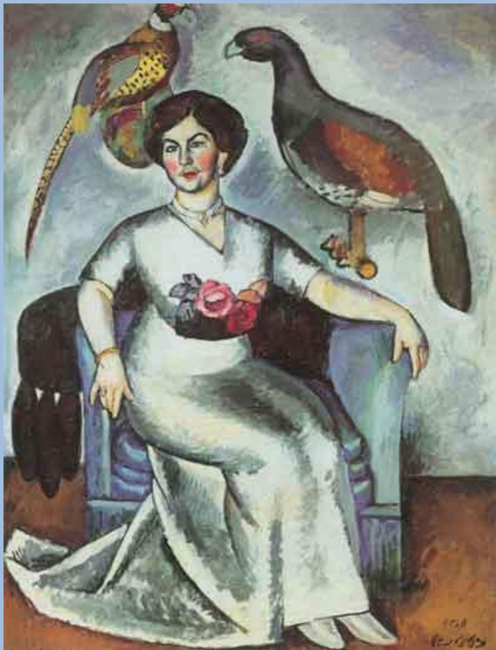
Илья Машков. Дама с фазанами. 1911