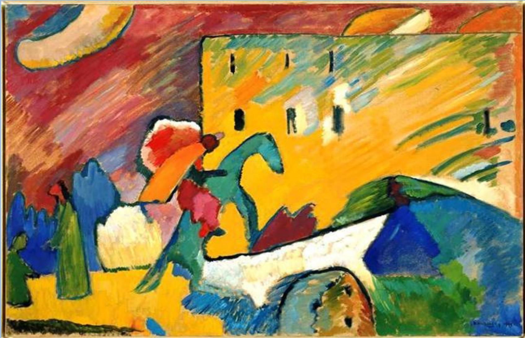
Василий Кандинский. Импровизация 3.1909