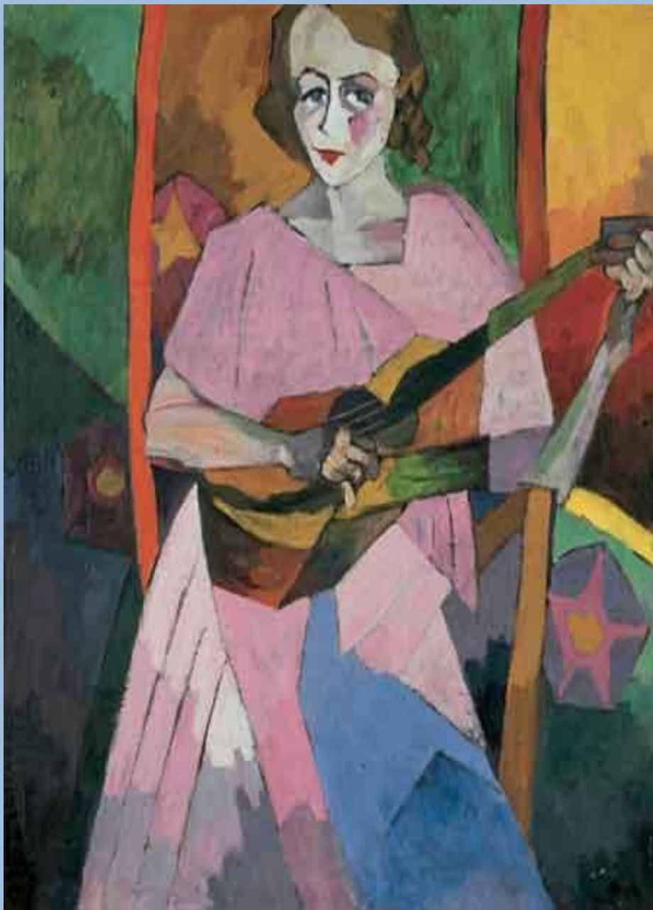
Аристарх Лентулов. Девушка с гитарой. 1913