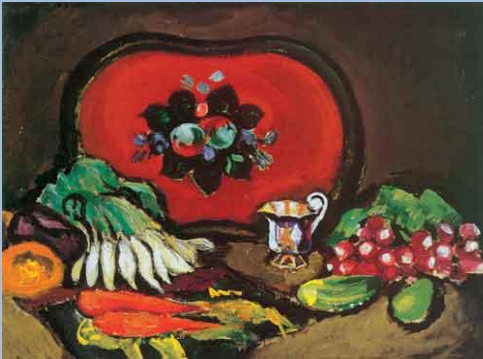
Петр Кончаловский. Поднос и овощи.1910