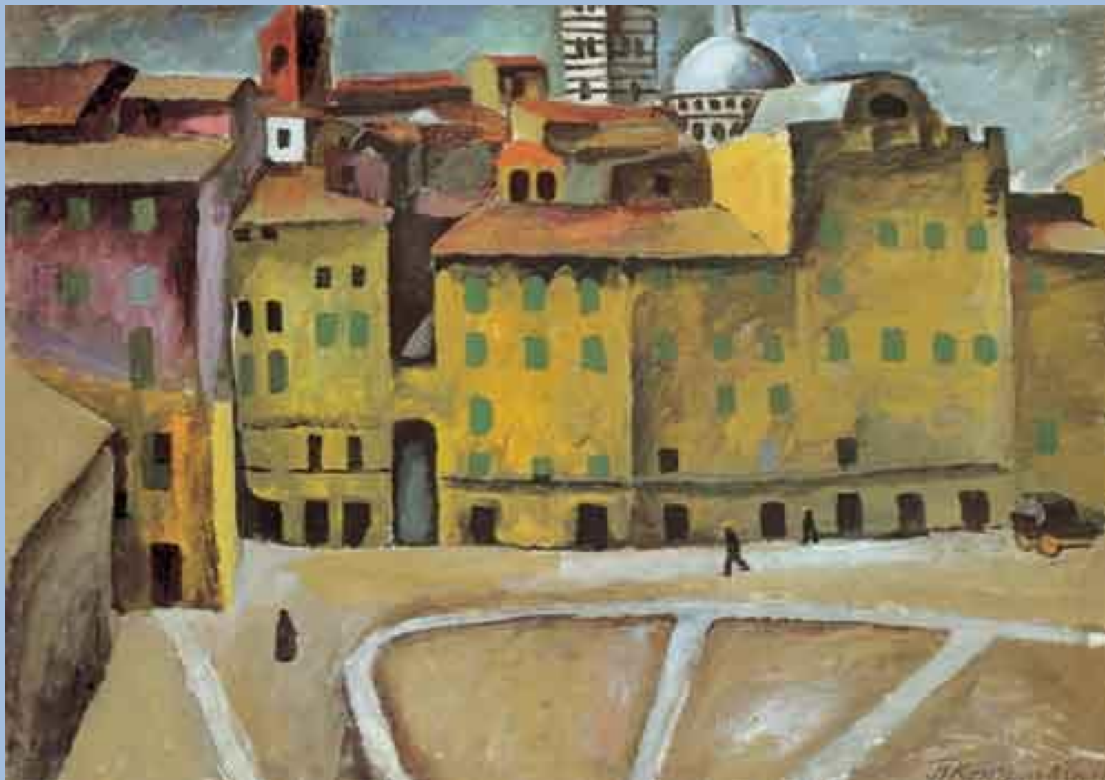
Петр Кончаловский. Площадь Синьории в Сиене. 1912