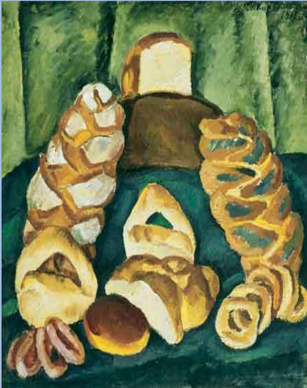
Петр Кончаловский. Хлебы на зеленом. 1913