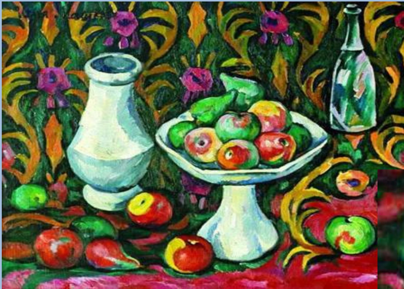
И.Машков. Натюрморт с бутылкой, фруктами и кувшином.1910