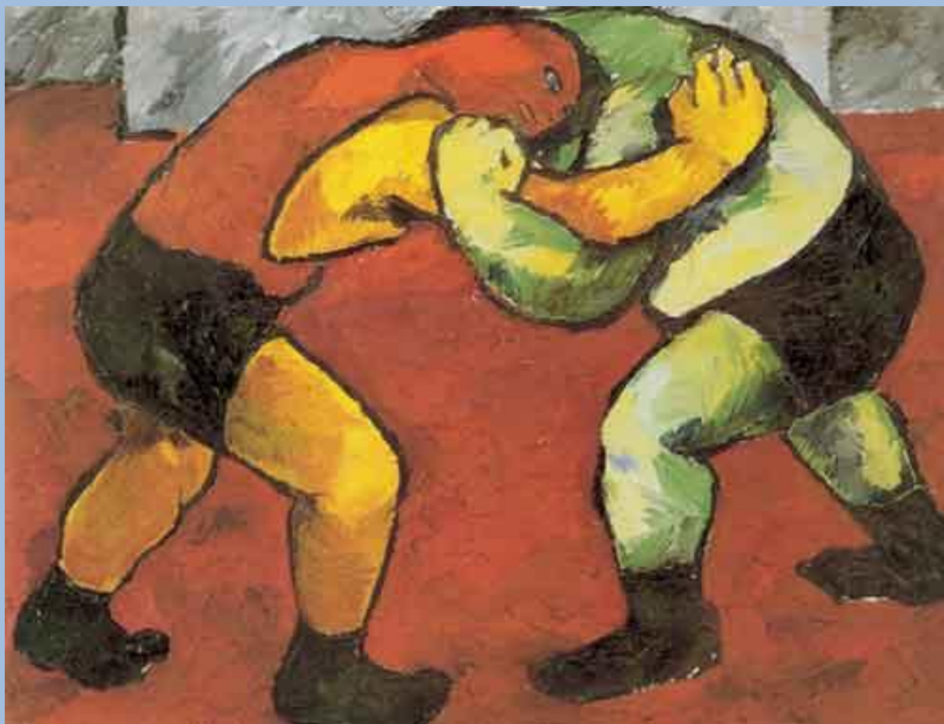
Наталья Гончарова. Борцы. 1908-1909