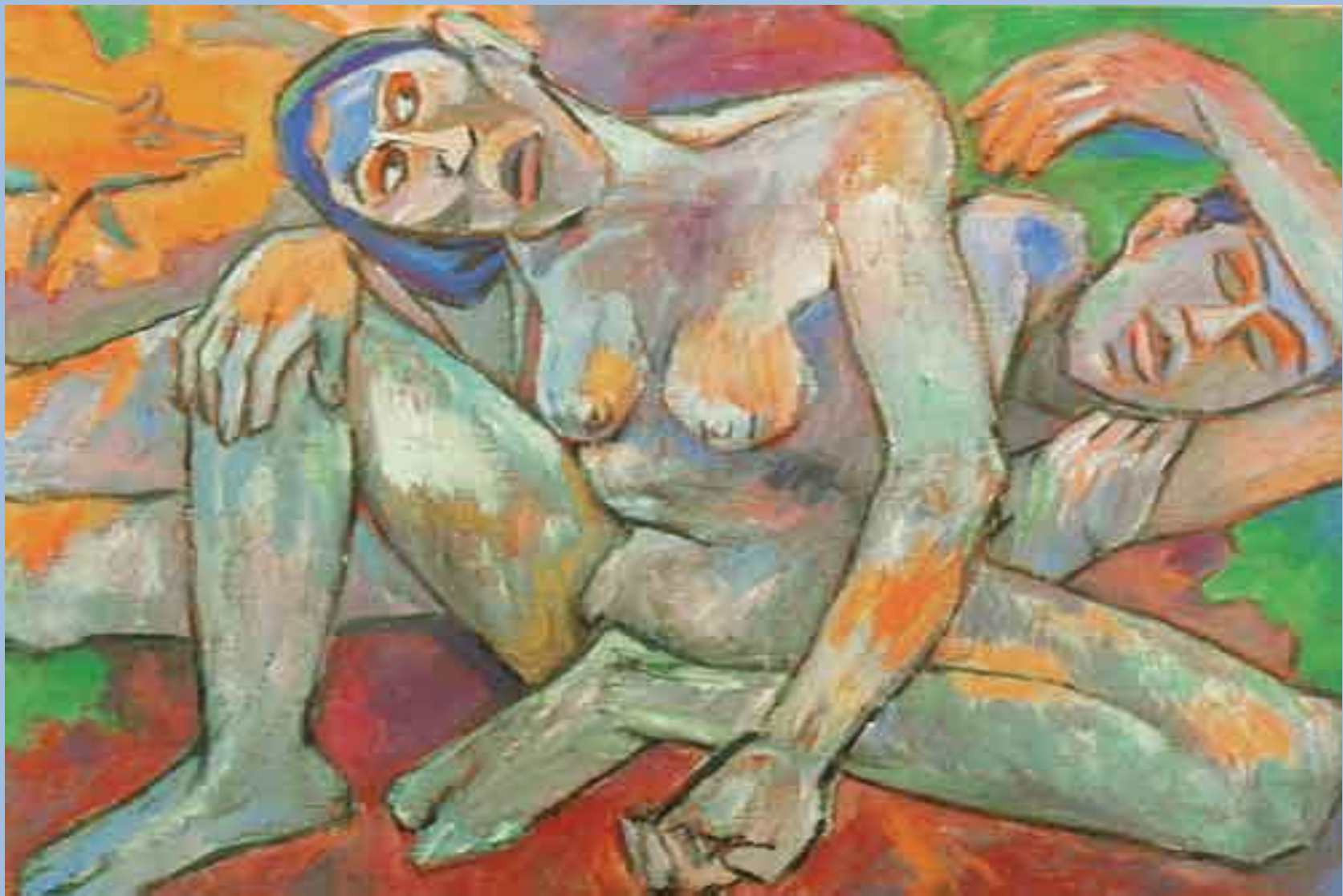
Михаил Ларионов. Деревенские купальщицы. 1909