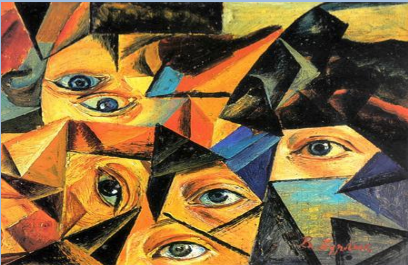
Владимир Бурлюк. Глаза. 1909