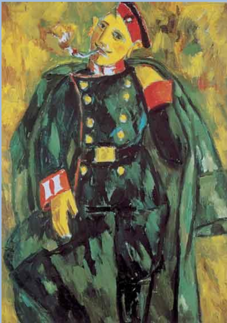
Михаил Ларонов. Солдат (курятый). 1910-1911