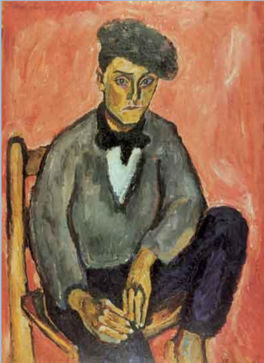
Петр Кончаловский. Испанский мальчик. 1910