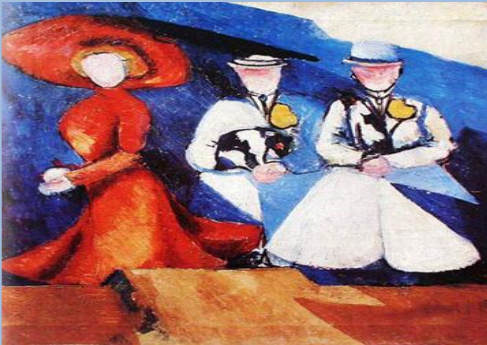
Александра Экстер. Три женские фигуры. 1910