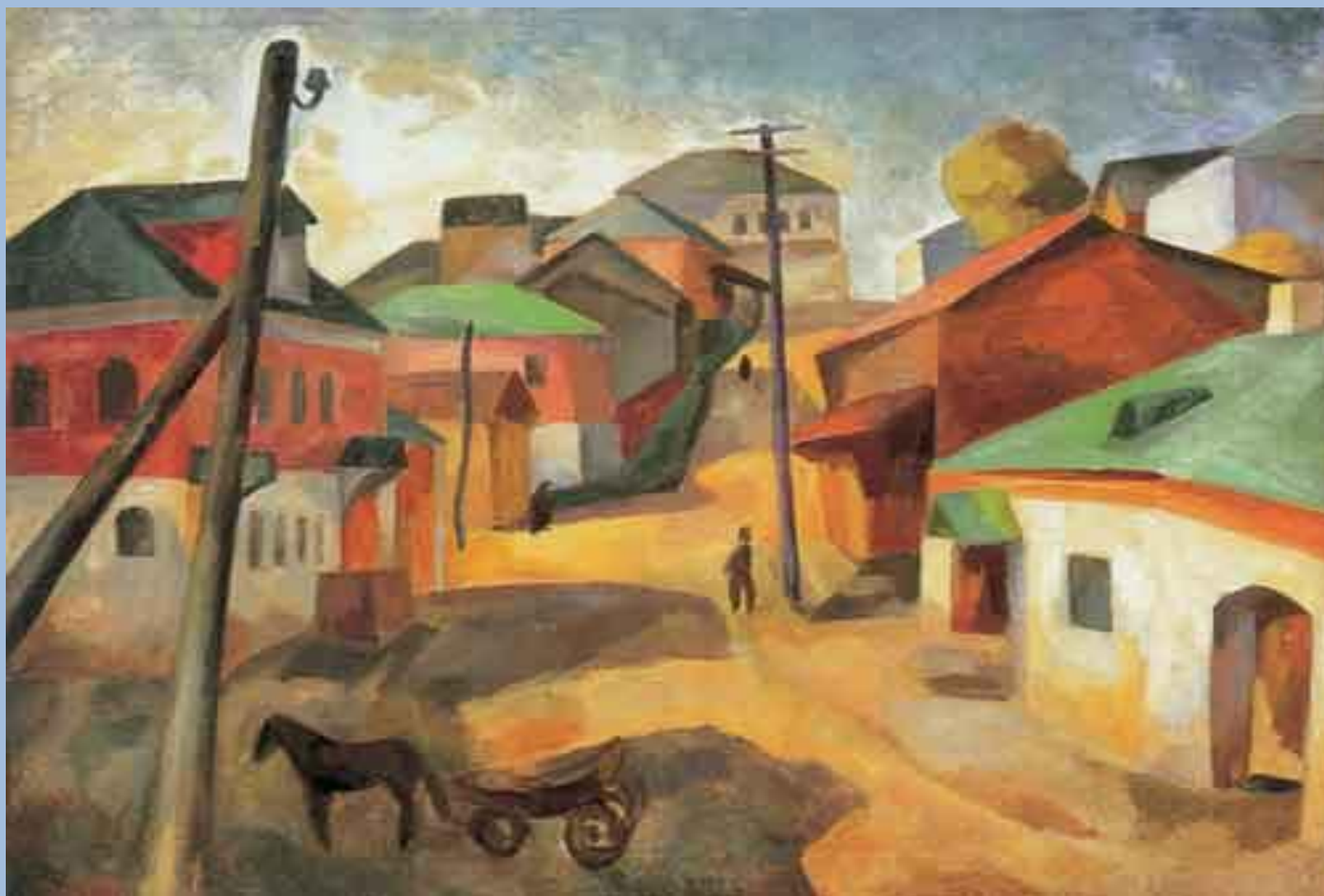
Роберт Фальк. Старая Руза. 1913