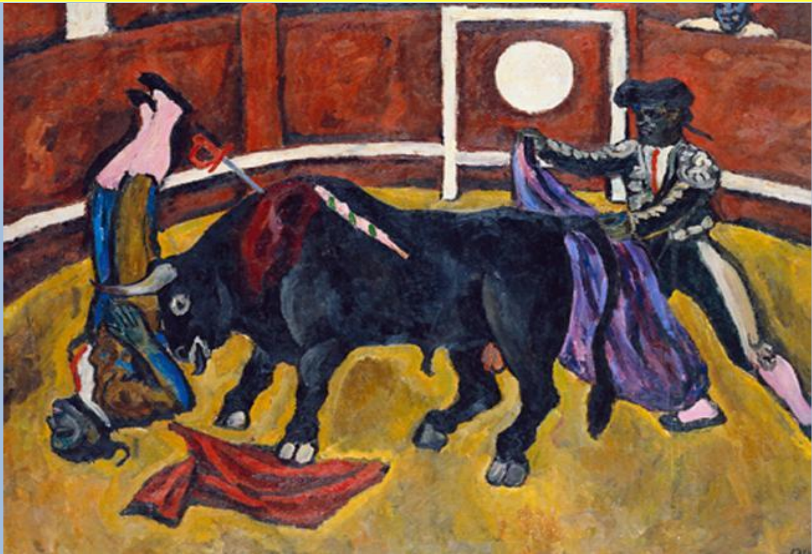
Петр Кончаловский. Бой быков. 1910