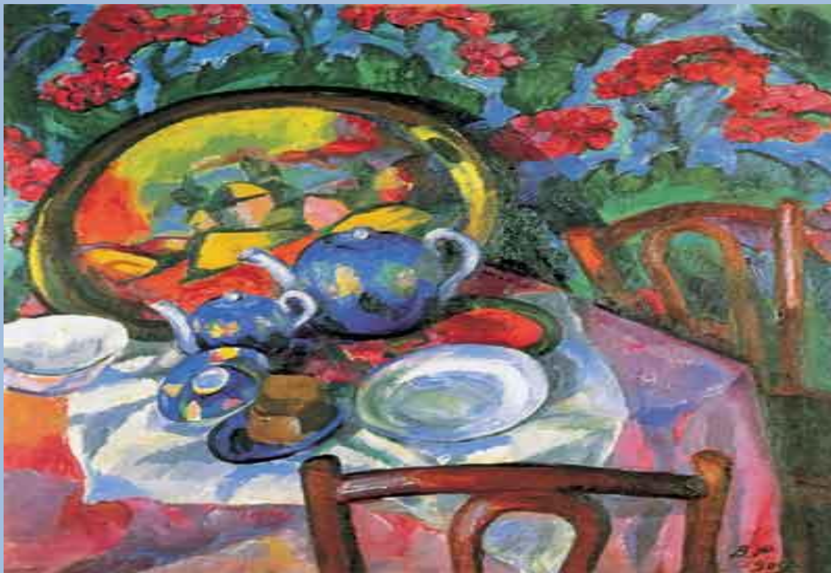
Василий Рождественский. Натюрморт. Трактирная посуда. 1910