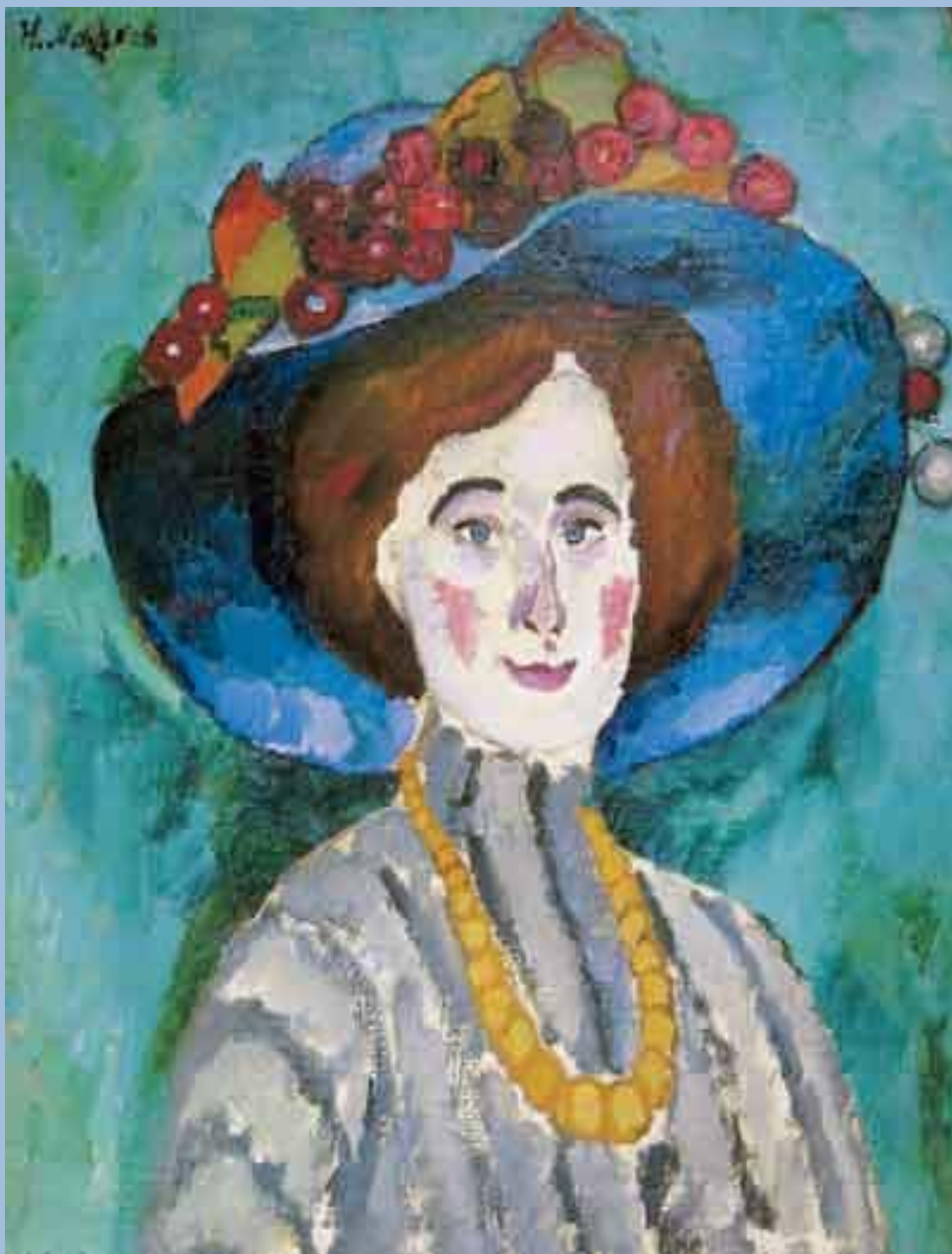
Илья Машков. Дама в шляпе. 1909