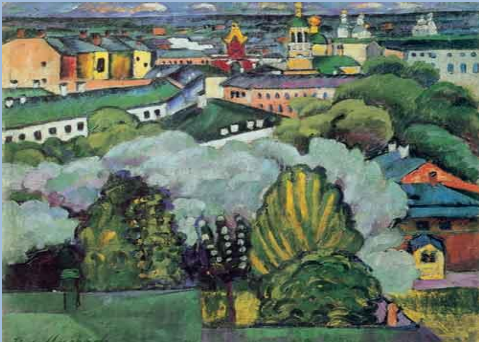
Илья Машков. Городской пейзаж. 1911