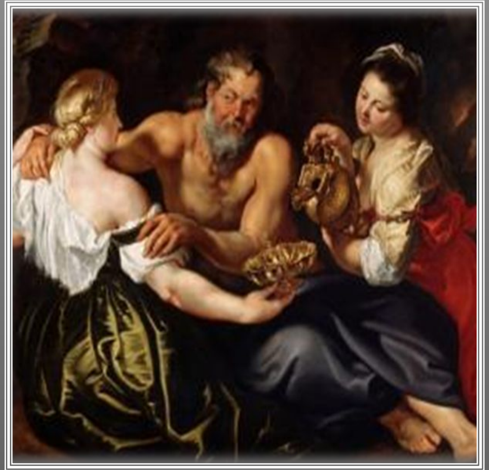
«Лот и его дочери»