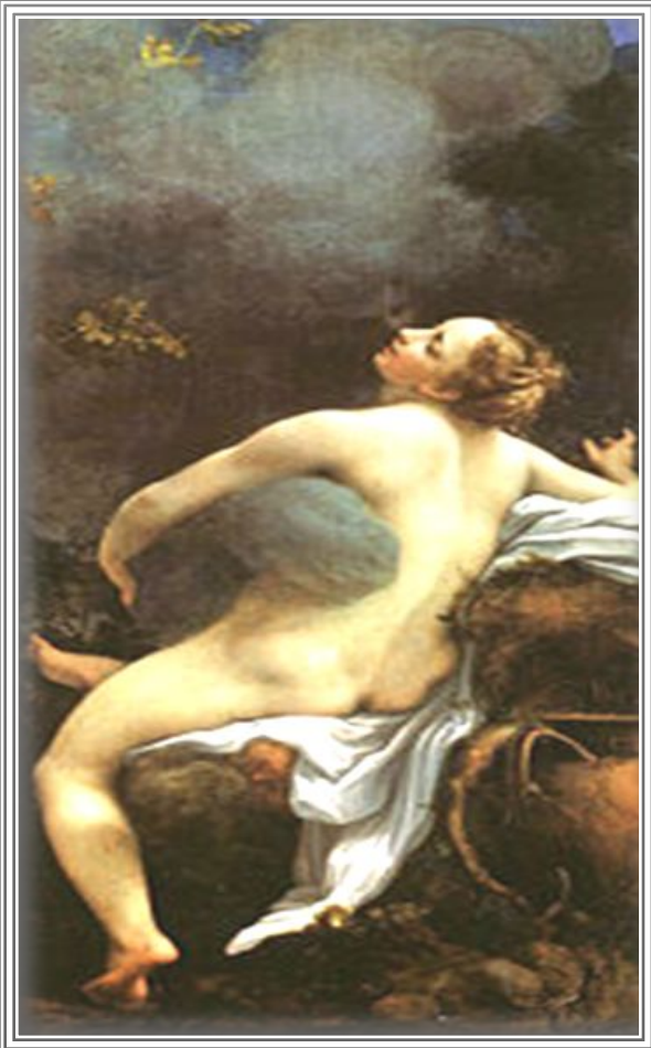
«Юпитер и Ио»