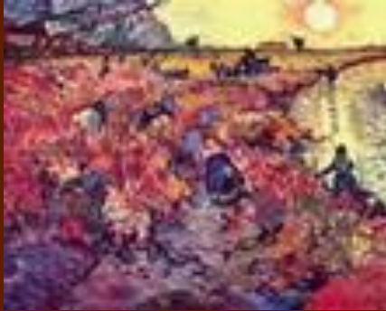
Красные виноградники. Ван Гог