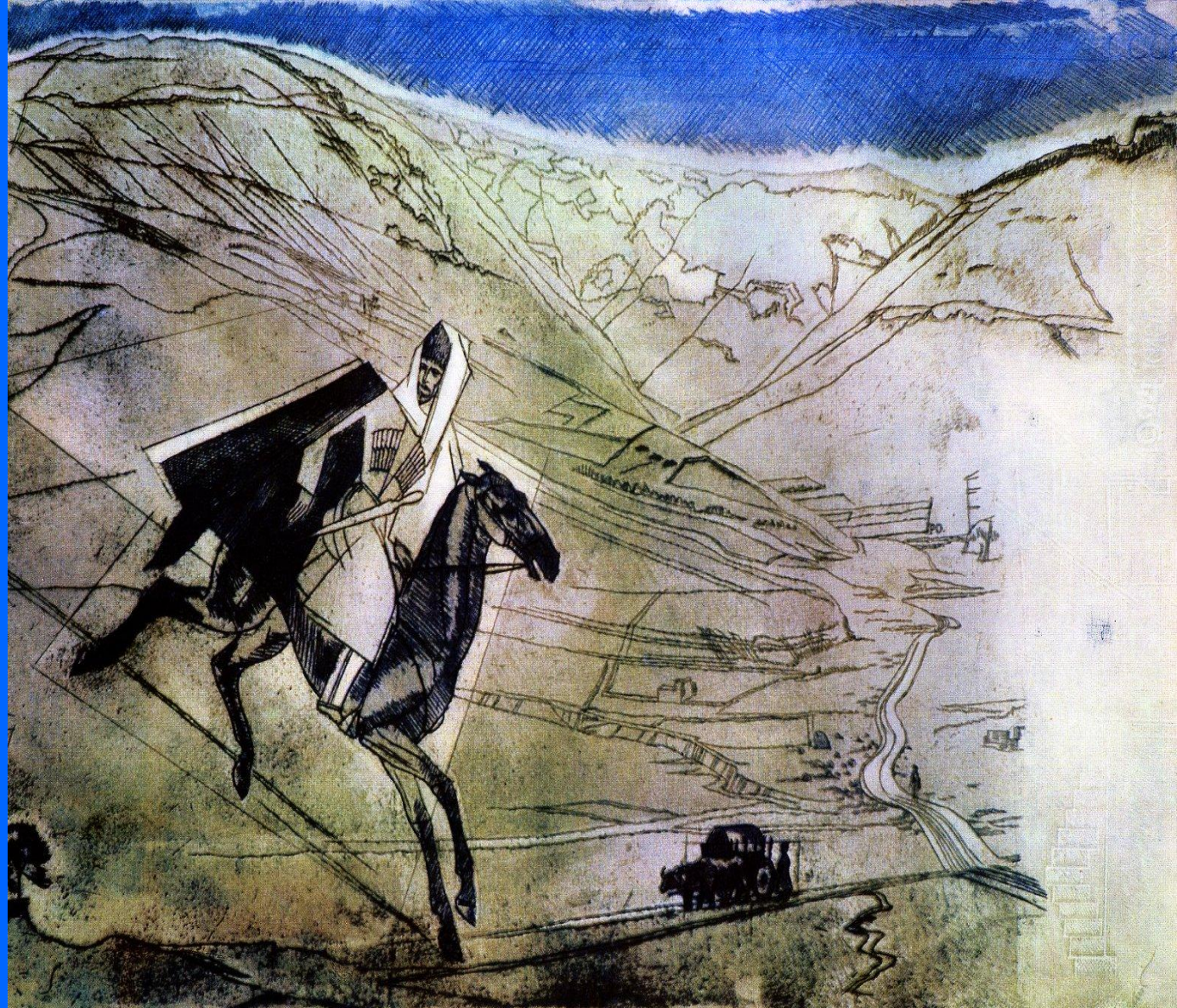
«Синие камни. Кисловодск»

И.И. Нивинский – один из зачинателей советского офорта. Нивинский по характеру своего творчества был новатор, искатель новых путей. Мастер лирического пейзажа, он явился также создателем в офорте индустриального пейзажа. Нивинский много экспериментировал в технике офорта, ему принадлежит открытие нового своеобразного метода печати цветного офорта.