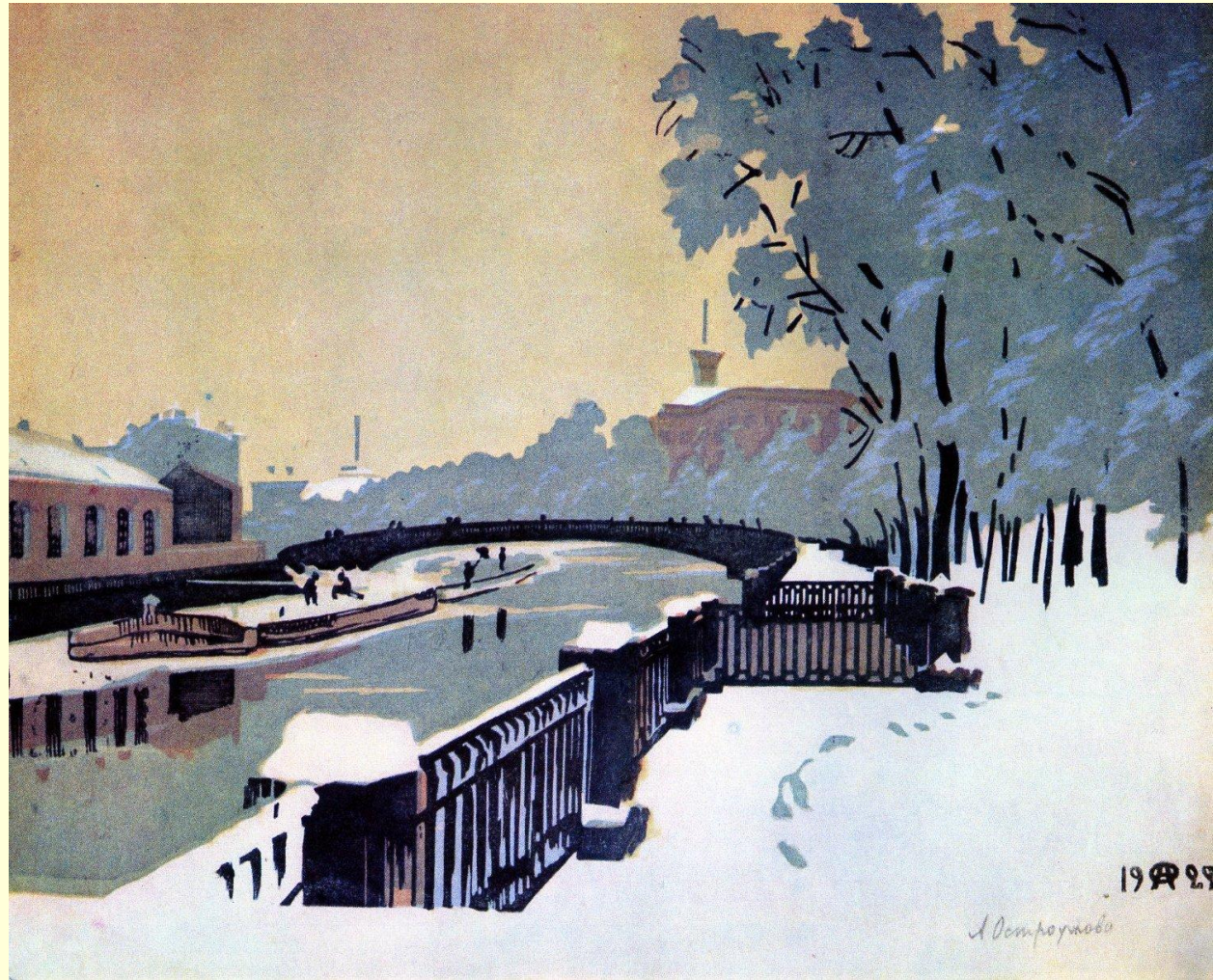
Летний сад в инее.

Ученица Репина Остроумова – Лебедева оставила живопись ради гравюры. Работая всю жизнь в гравюре на дереве (черной и цветной), она открыла богатые изобразительные возможности и с большим мастерством выразила в ней свои творческие замыслы. Гравюры Остроумовой – Лебедевой пленяют своей поэтичностью, строгой сдержанностью и благородной простотой