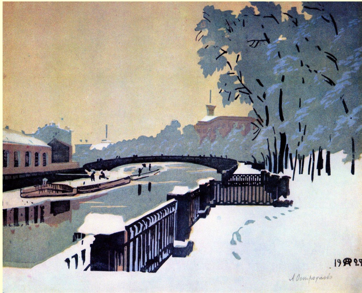
Летний сад в инее.

Ученица Репина Остроумова – Лебедева оставила живопись ради гравюры. Работая всю жизнь в гравюре на дереве (черной и цветной), она открыла богатые изобразительные возможности и с большим мастерством выразила в ней свои творческие замыслы. Гравюры Остроумовой – Лебедевой пленяют своей поэтичностью, строгой сдержанностью и благородной простотой