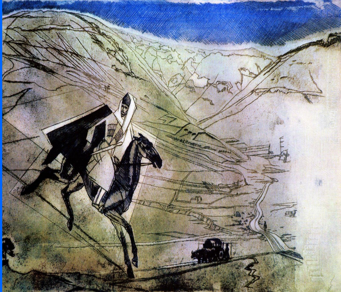
«Синие камни. Кисловодск»