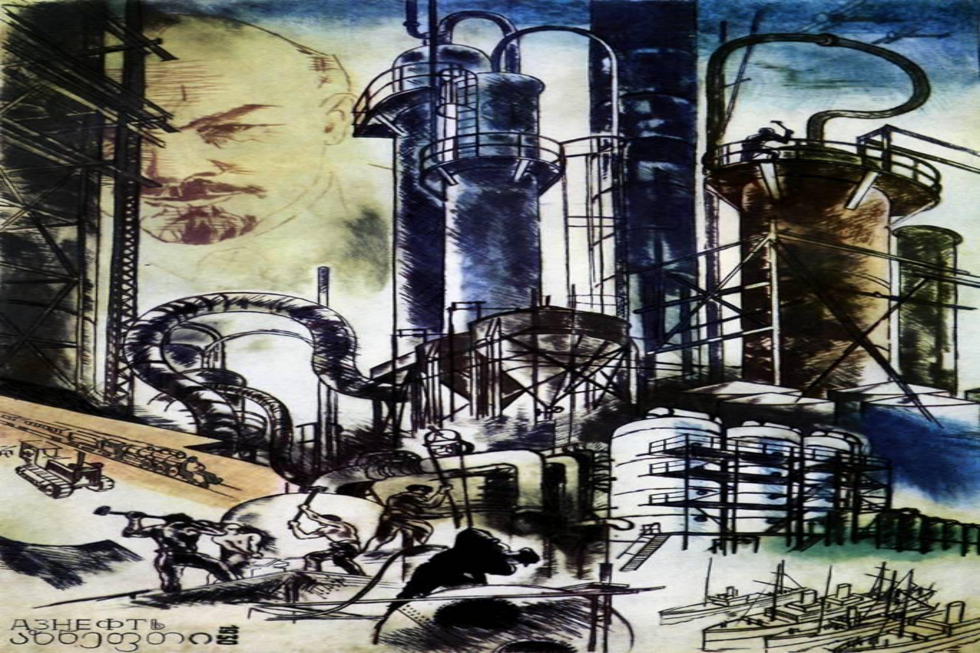
Азнефть. Цв. Офорт.