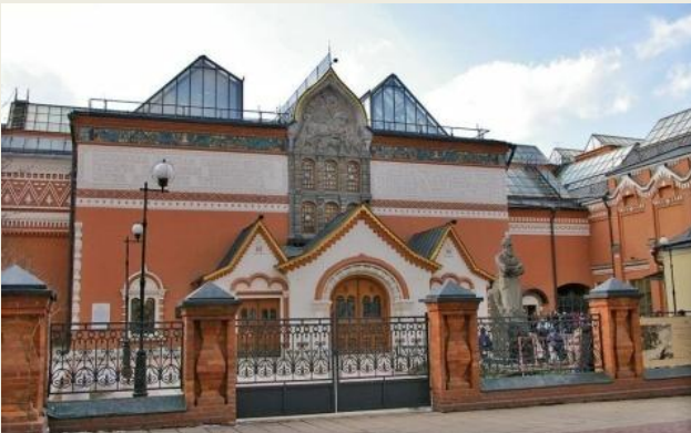
3. Третьяковская галерея в Москве.