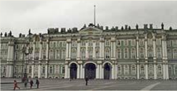
1. Эрмитаж в Санкт-Петербурге