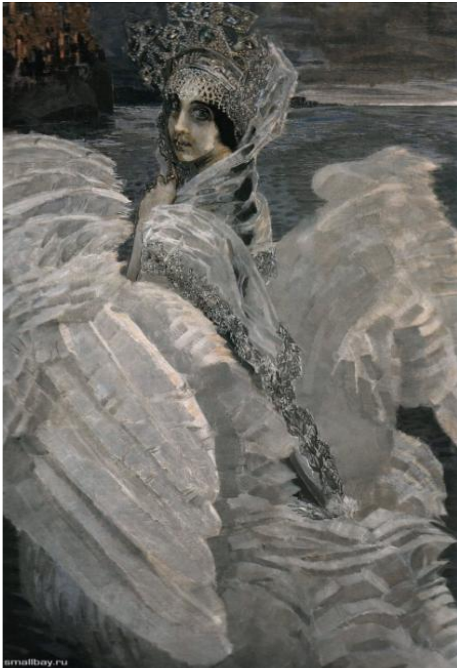
Врубель М.А. «Царевна –Лебедь»