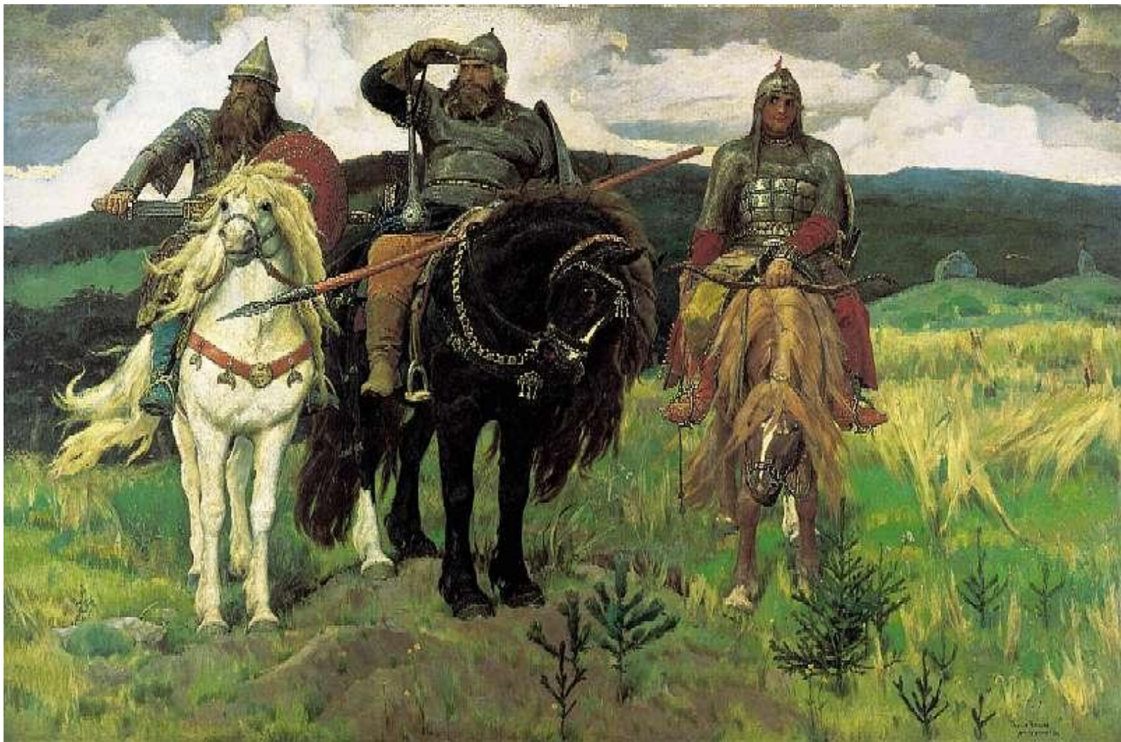
В.М. Васнецов «Богатыри»