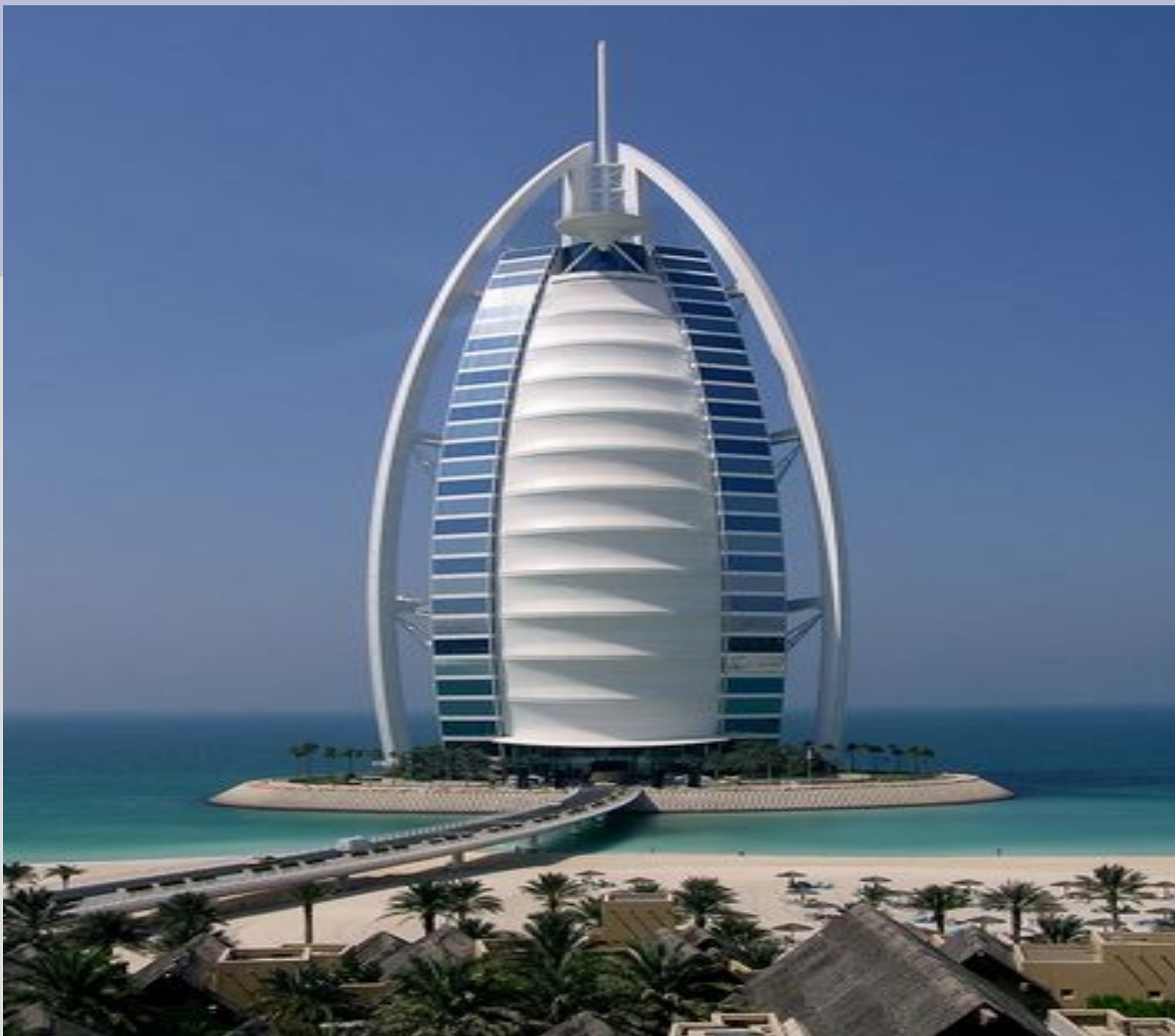
Отель Парус в Дубае