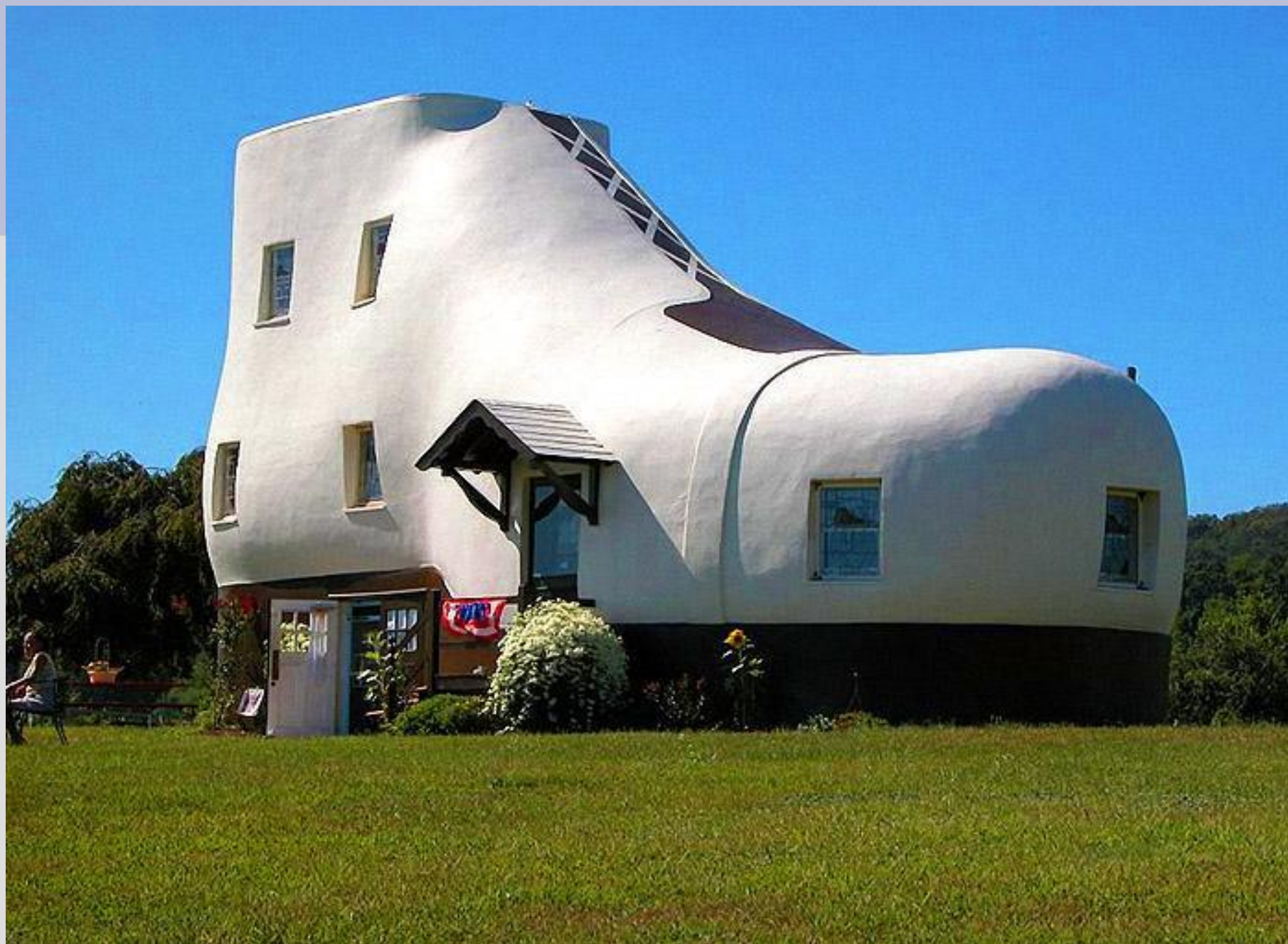
Дом-ботинок, Пенсильвания, США