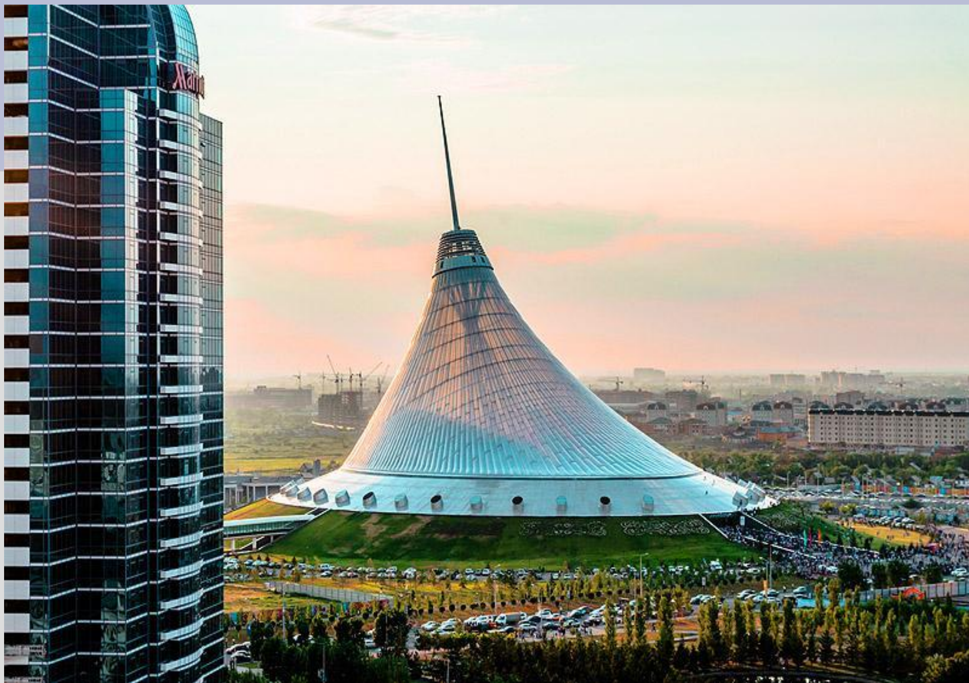
«Хан Шатыра»-торгово-развлекательный центр, Астана, Казахстан