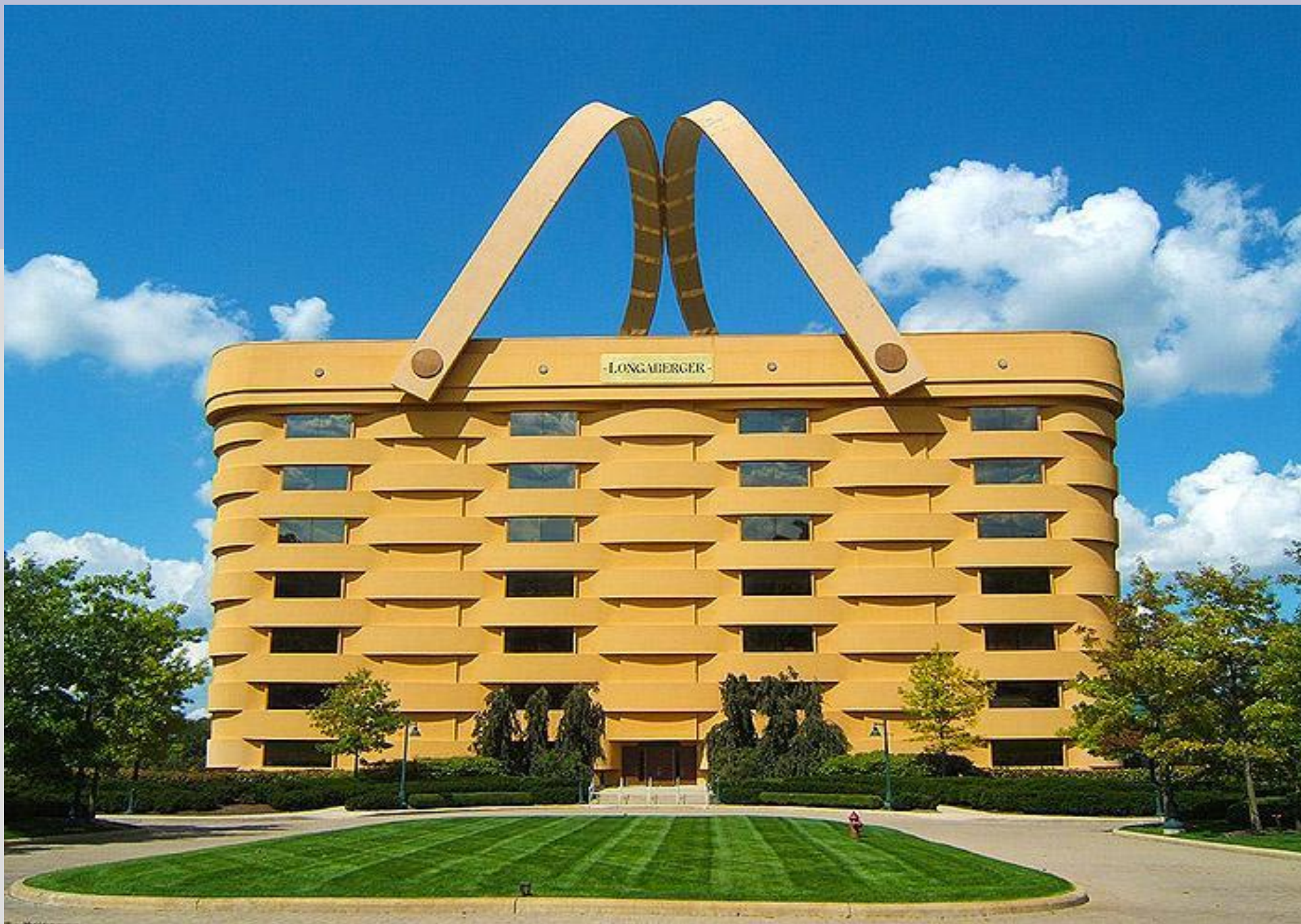
Здание-корзина, Огайо, США