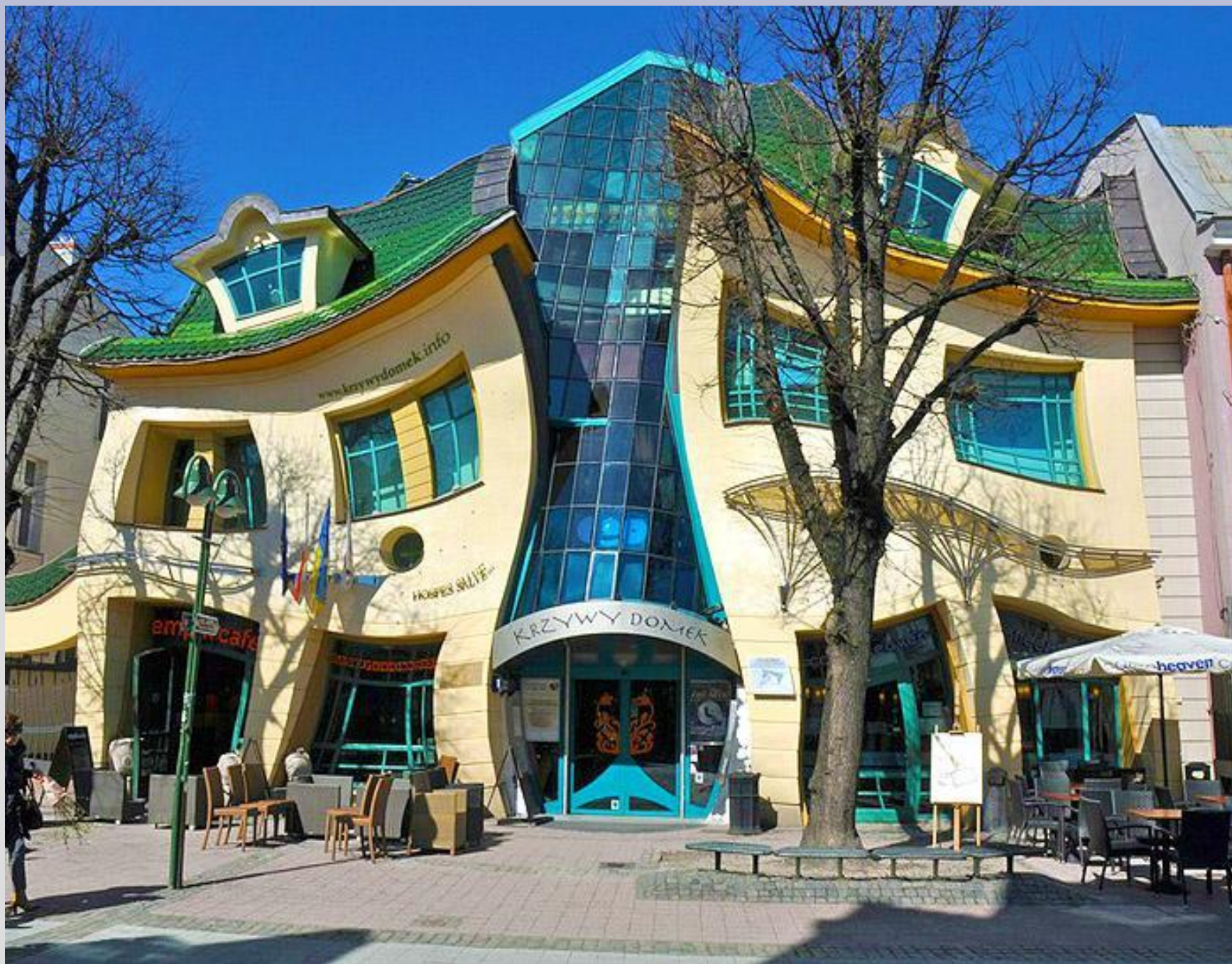
Кривой дом, Сопот, Польша