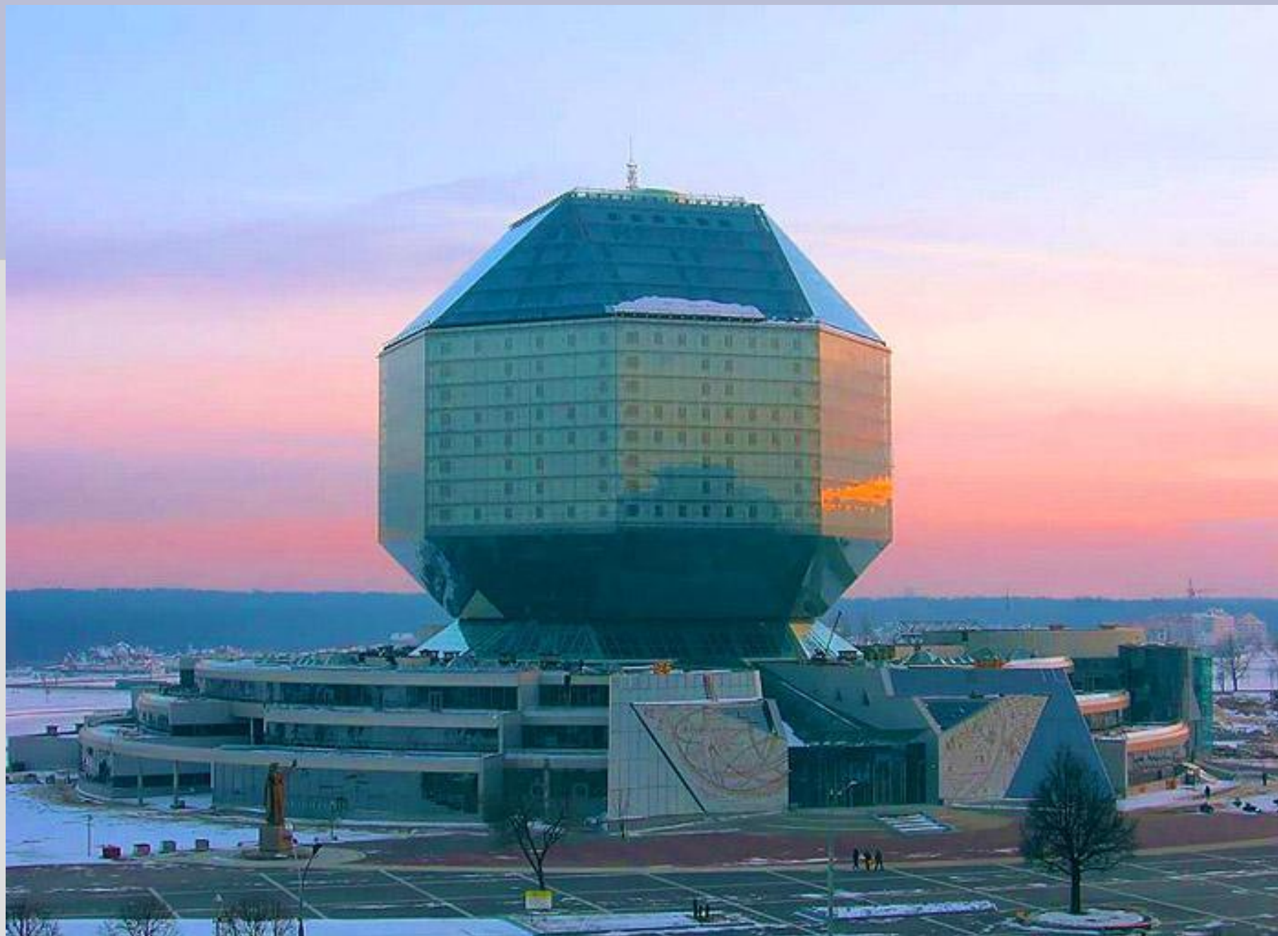
Национальная библиотека, Минск, Беларусь