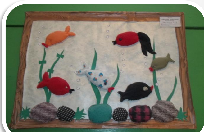
Аппликация, декоративно – прикладная работа. Групповая работа “ Аквариум”