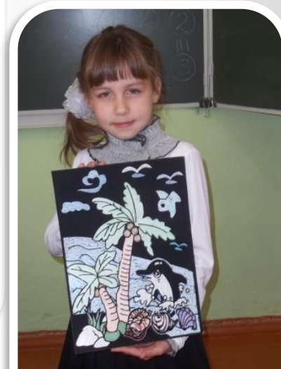
Рисование по бархатной бумаге..