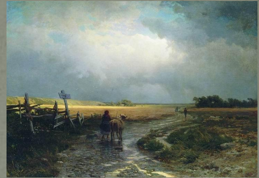
После дождя. Просёлок. (1867-1869)