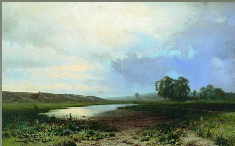
Мокрый луг (1872)