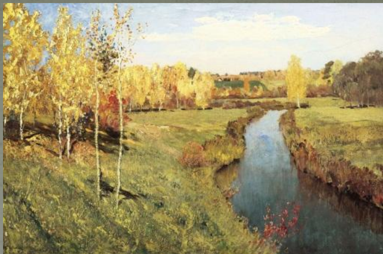
Золотая осень ( 1895)