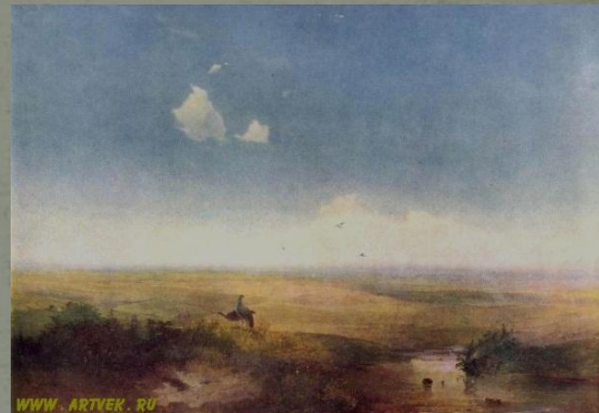
Степь днём (1852)