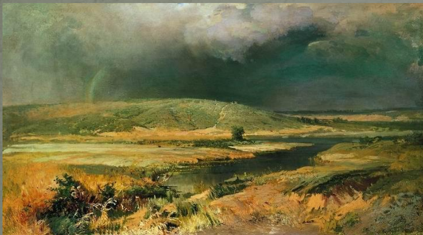
Волжские лагуны (1870)