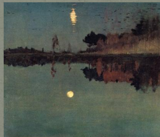
Сумерки. луна (1899)