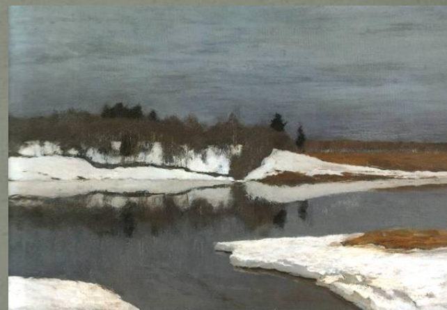
Ранняя весна (1898)