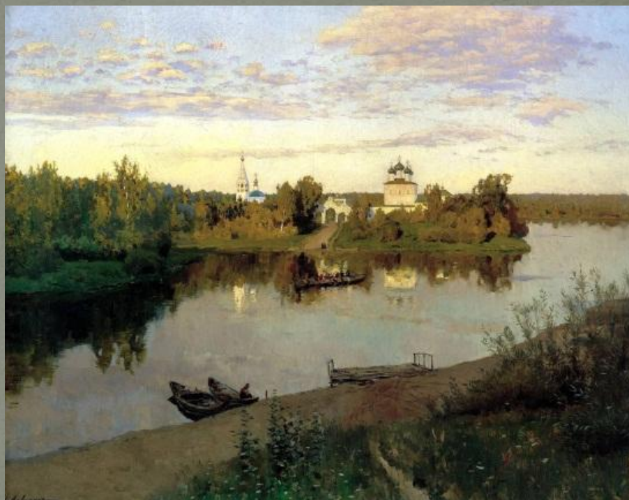
Вечерний звон (1892)