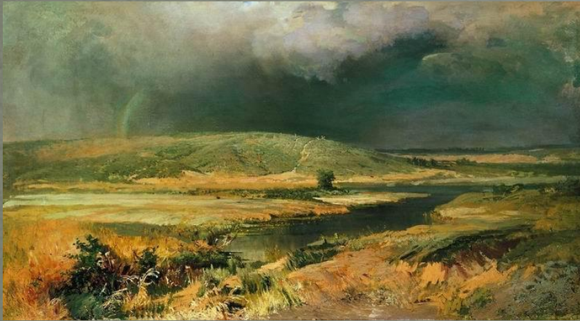
Волжские лагуны (1870)