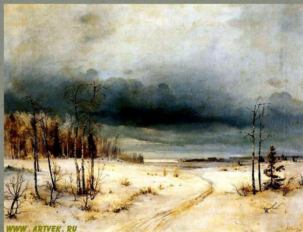
Зима. Конец (1870-1880)