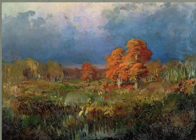
Болото в лесу. Осень (1871—1873)