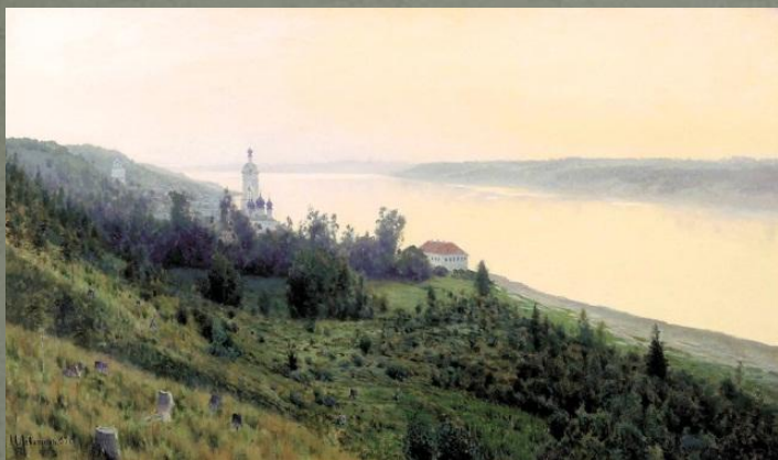
Вечер. Золотой плёс (1889)