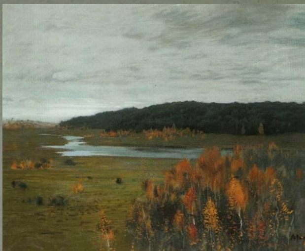
Долина реки. Осень (1895)