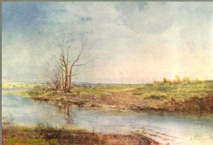
Весна. Этюд (1870-е)