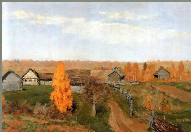
Золотая осень Слобода (1898)