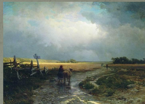
После дождя. Просёлок. (1867-1869)