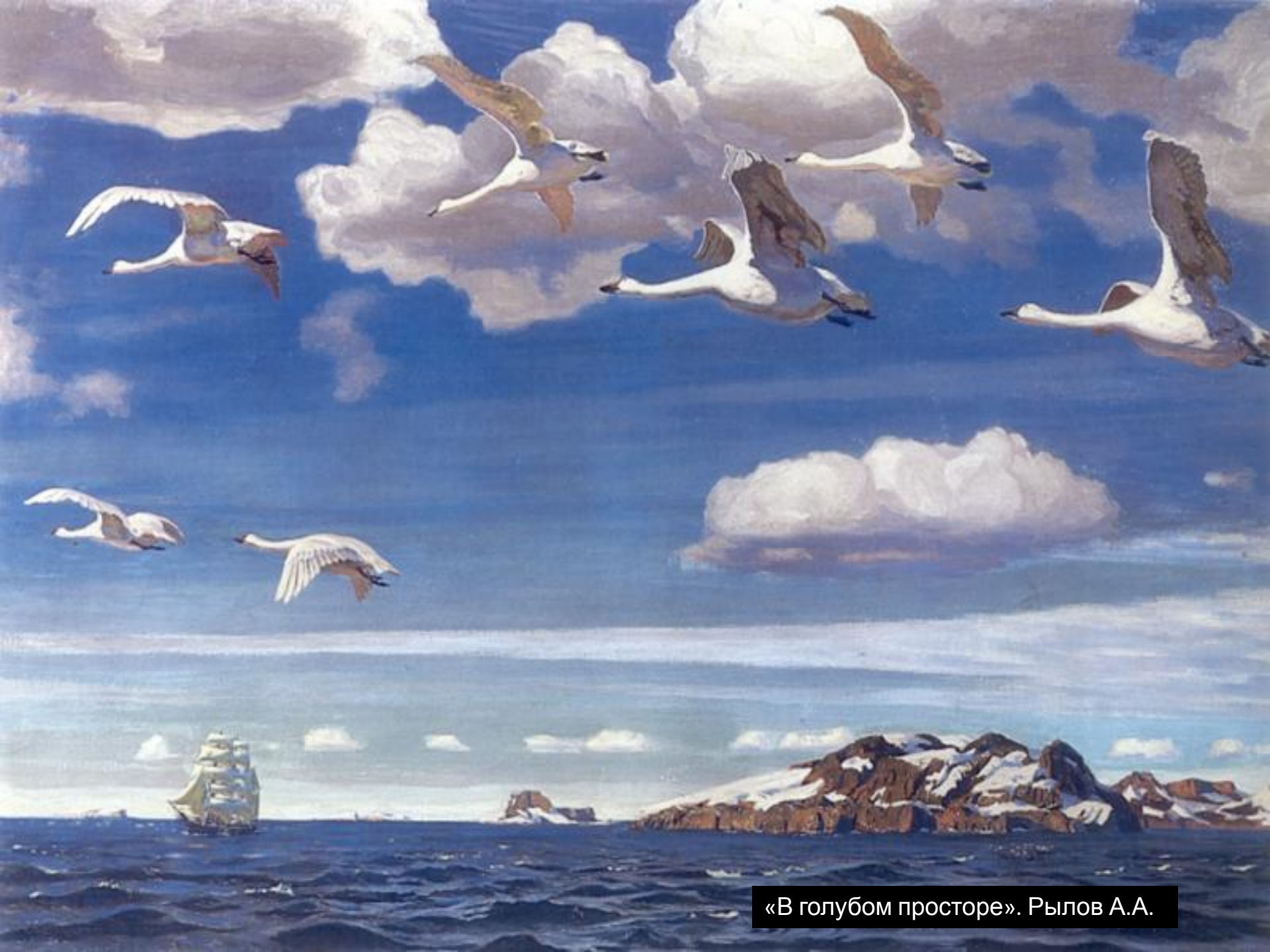
«В голубом просторе». Рылов А.А.