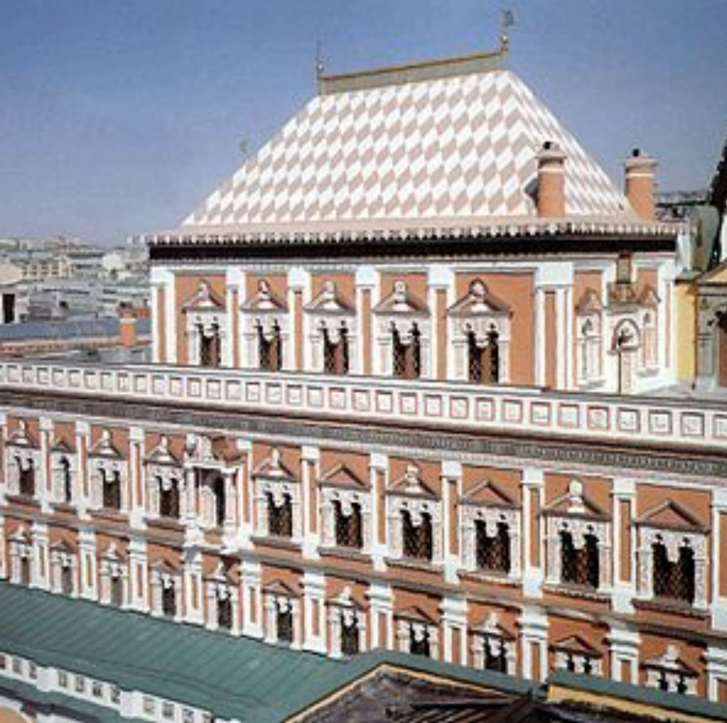
*Теремной дворец Московского Кремля, 2003 год