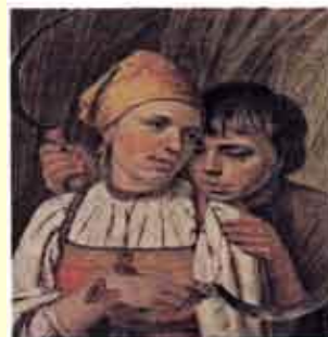
А. Венецианов. Жнецы

Он изображает разные стороны жизни человека: труд и отдых, праздники и будни, забавы и серьезные занятия.