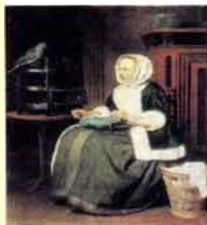
Г. Метсю. Девушка за работой.