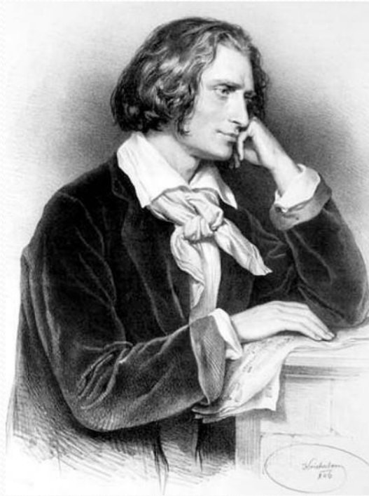
Ференц Лист (1811 – 1886)

«Мы были как влюбленные, как бешенные. И немудренно.