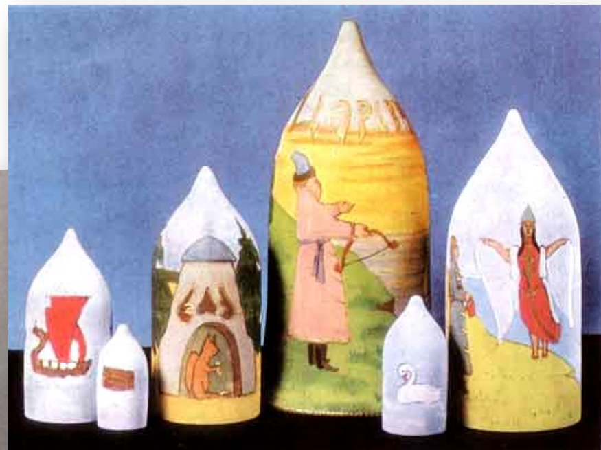
Матрешка «Сказка о царе Салтане»