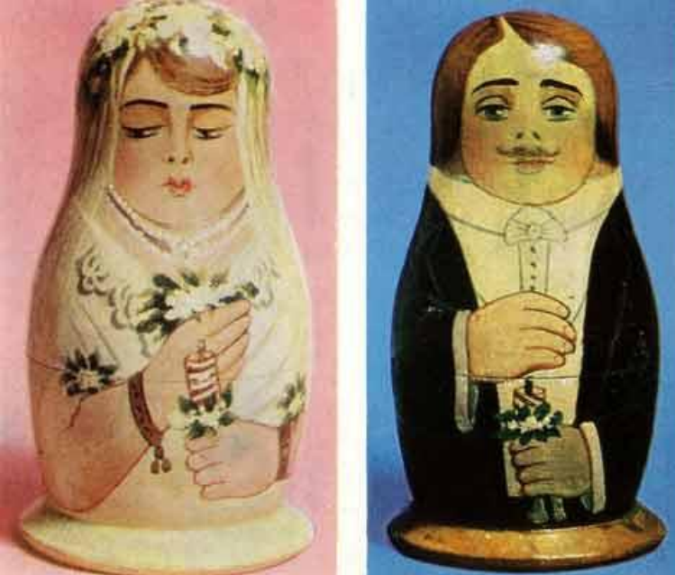
«Жених и невеста»