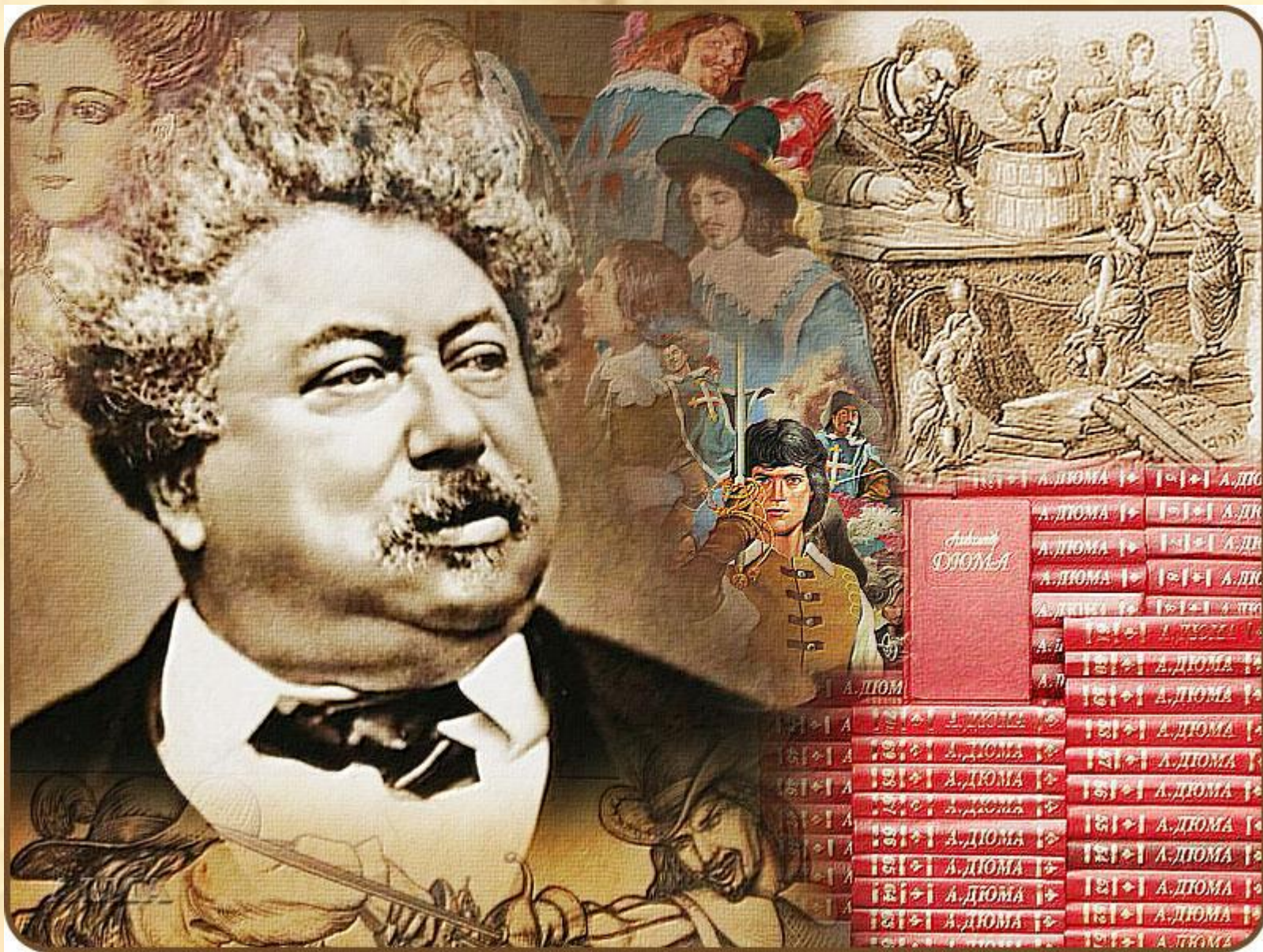
«Три мушкетера», «20 лет спустя», «Королева Марго», Граф Монте-Кристо»