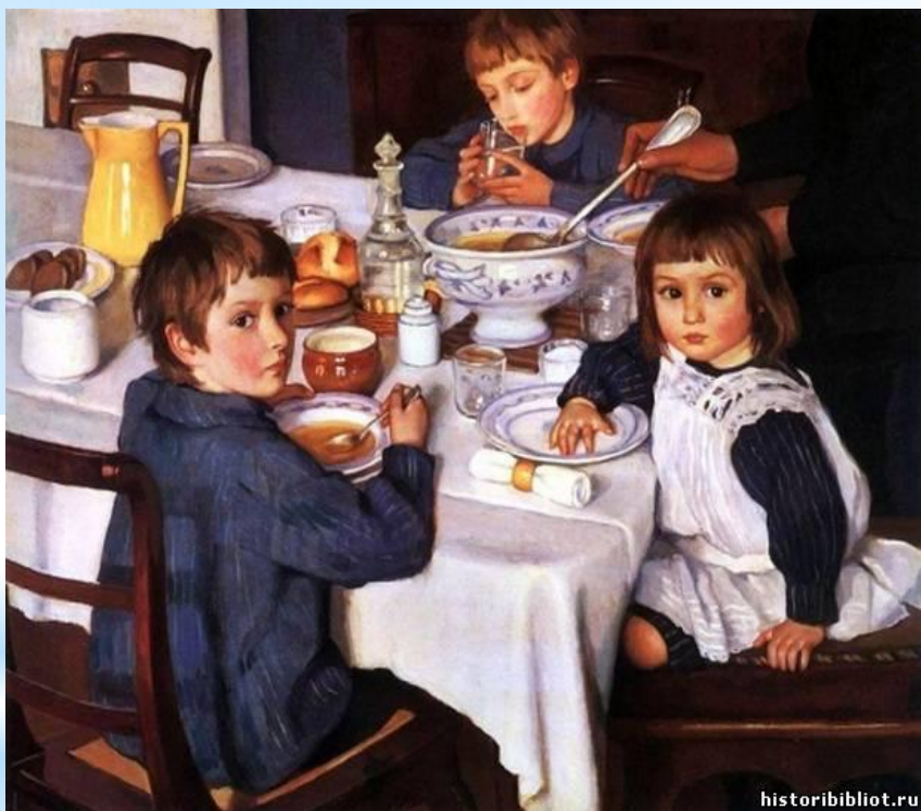
З. Серебрякова «За завтраком»;