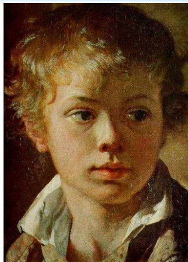
Портрет сына художника

* Вторая картина — портрет сына художника Василия Андреевича Тропинина, который хранится в Государственной Третьяковской галерее в Москве.