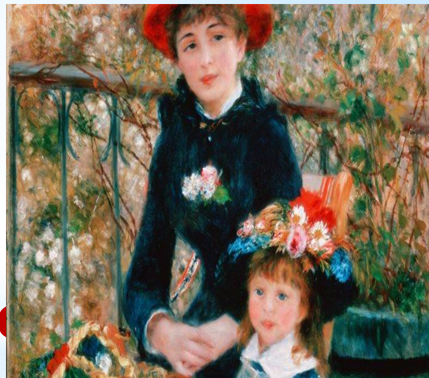
урока О. Ренуар «Две сестры (На террасе)»