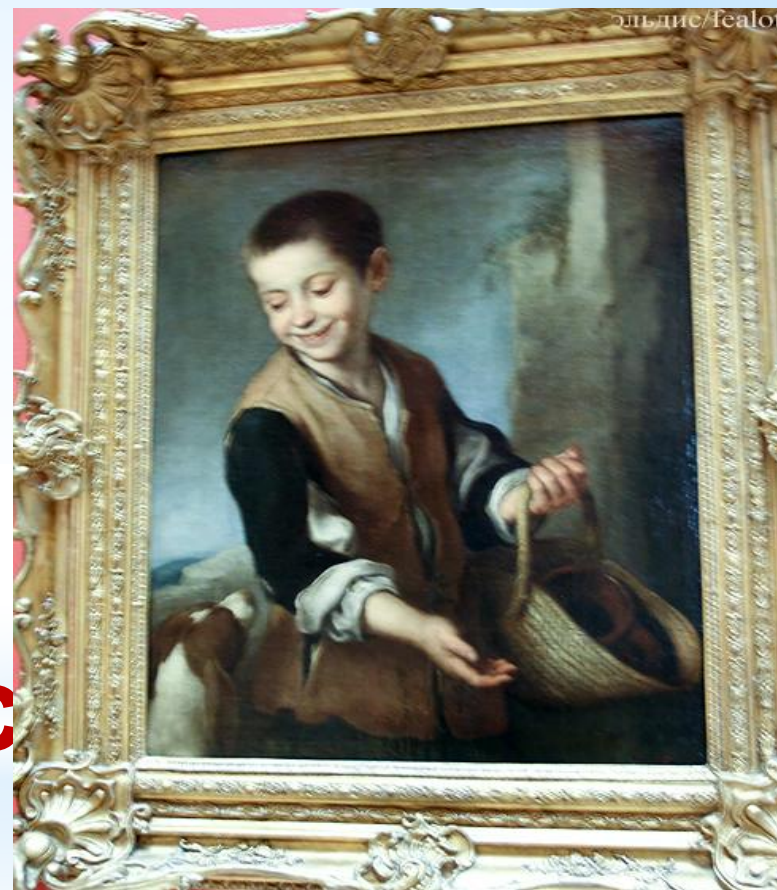
Б. Мурильо «Мальчик с собакой»