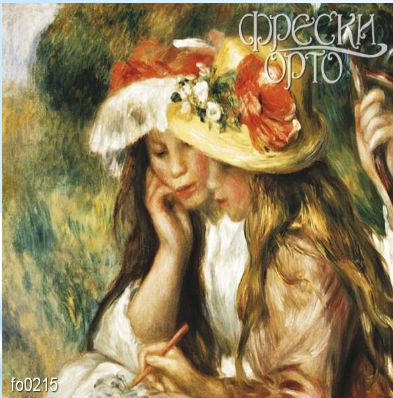
О.Ренуар. Две читающие девочки в саду