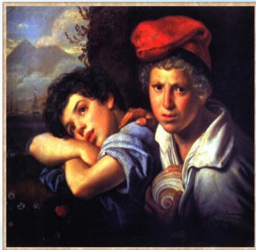
О. Кипренский «Неаполитанские мальчики-рыбаки»