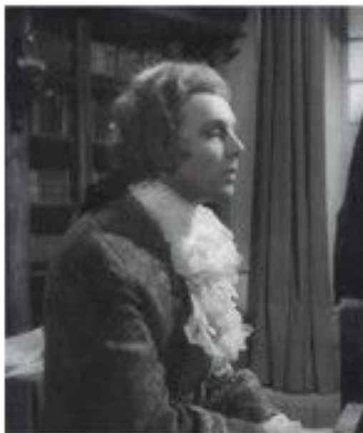
И. Смолтуновский — Сальери