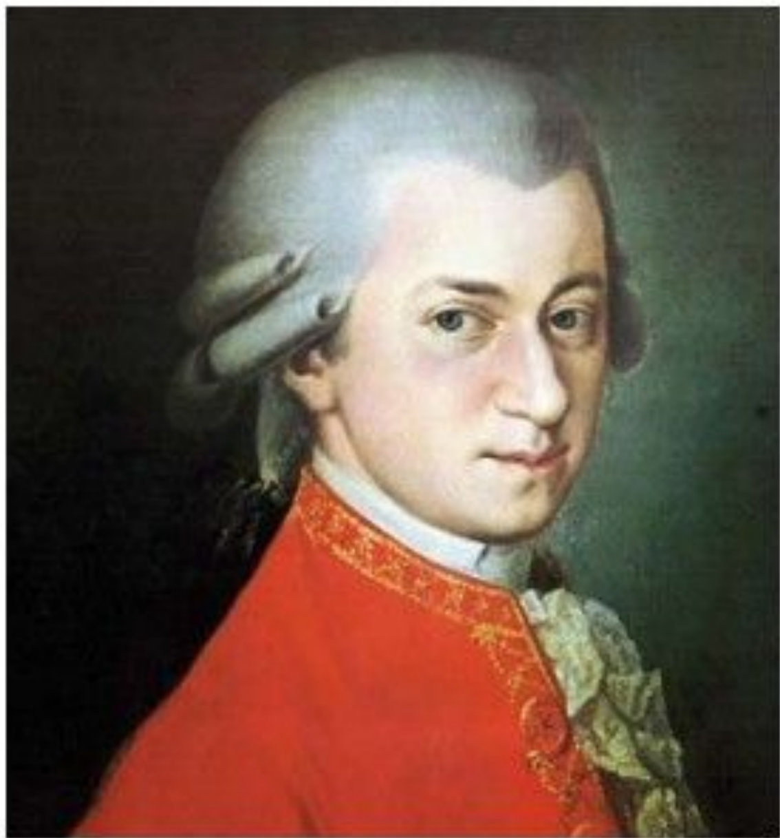
Неизвестный художник. В.-А. Моцарт