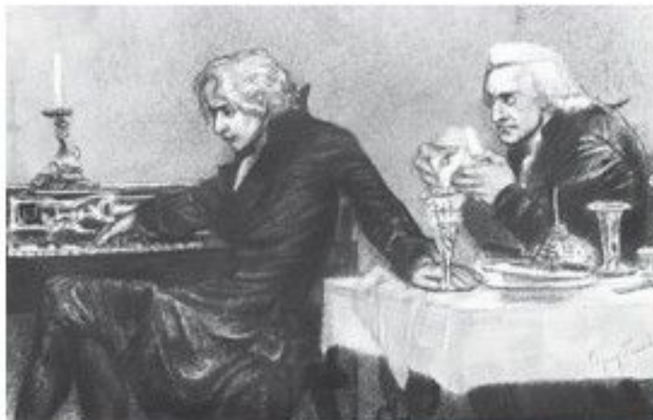
М. Врубель. Иллюстрация к трагедии А. Пушкина «Моцарт и Сальери»