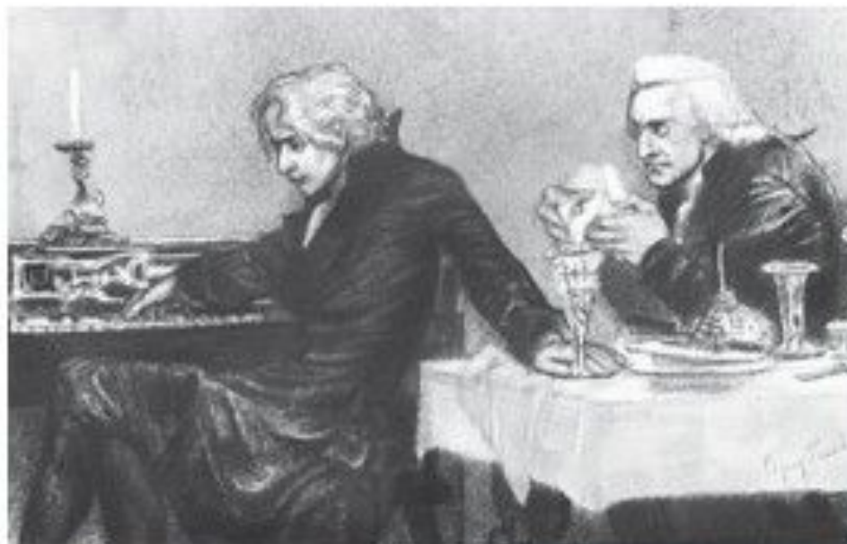
М. Врубель. Иллюстрация к трагедии А. Пушкина «Моцарт и Сальери»